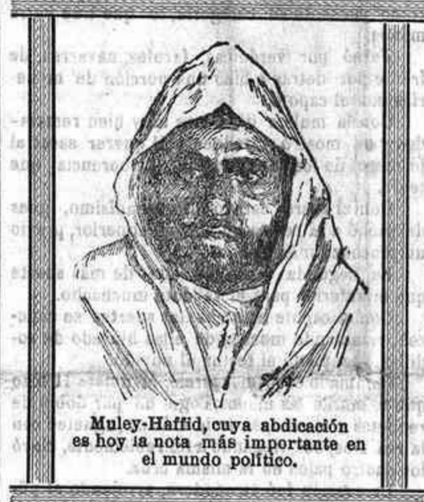
Muley-Haffid, cuya abdicación es hoy la nota más importante en el mundo político.