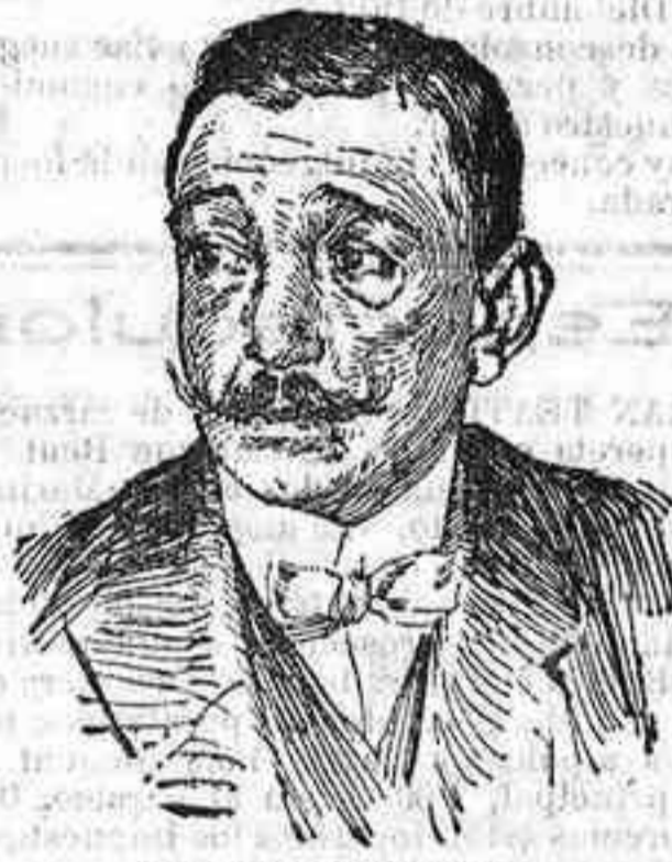
El conde de Sagasta, nuevo gobernador civil de Madrid.