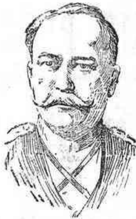
FIGURAS DE LA GUERRA.—El general conde de Vorontzoff Dechhoff, que manda uno de los ejércitos rusos del Dniester.

En el pantano del Guadalmeollo está la llave del porvenir de Córdoba. Con viva satisfacción, por tanto, publicamos estas noticias del rápido avance de las obras, y aplaudimos el propósito de abrir los trabajos a la curiosidad de todos, para que Córdoba vea cómo se va convirtiendo en realidad una esperanza tan hermosa y halagüeña.