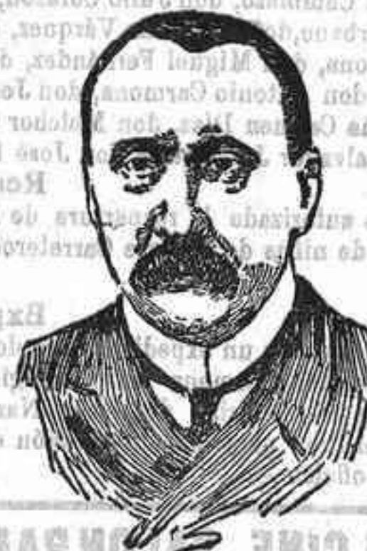
El señor Pokrowski, nuevo ministro de Estado de Rusia.

Es casi seguro que la instalación estará completamente terminada a fines de la semana próxima.