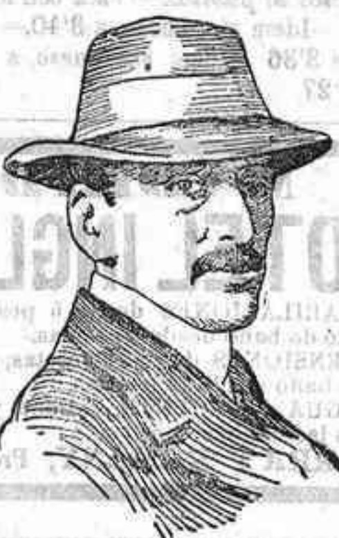
El conde Cremin, nuevo ministro de Estado de Austria-Hungria.

A la boda asistió una numerosa y distinguida concurrencia.