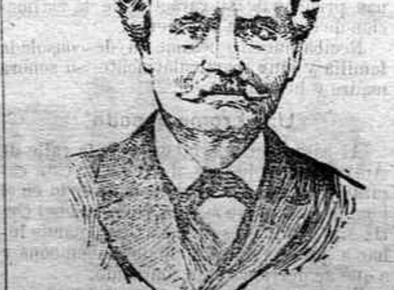
Balfour, representante del Imperio Británico.

LOS DELEGADOS DE LAS GRANDES POTENCIAS EN LAS CONFERENCIAS DE SAN SEBASTIÁN