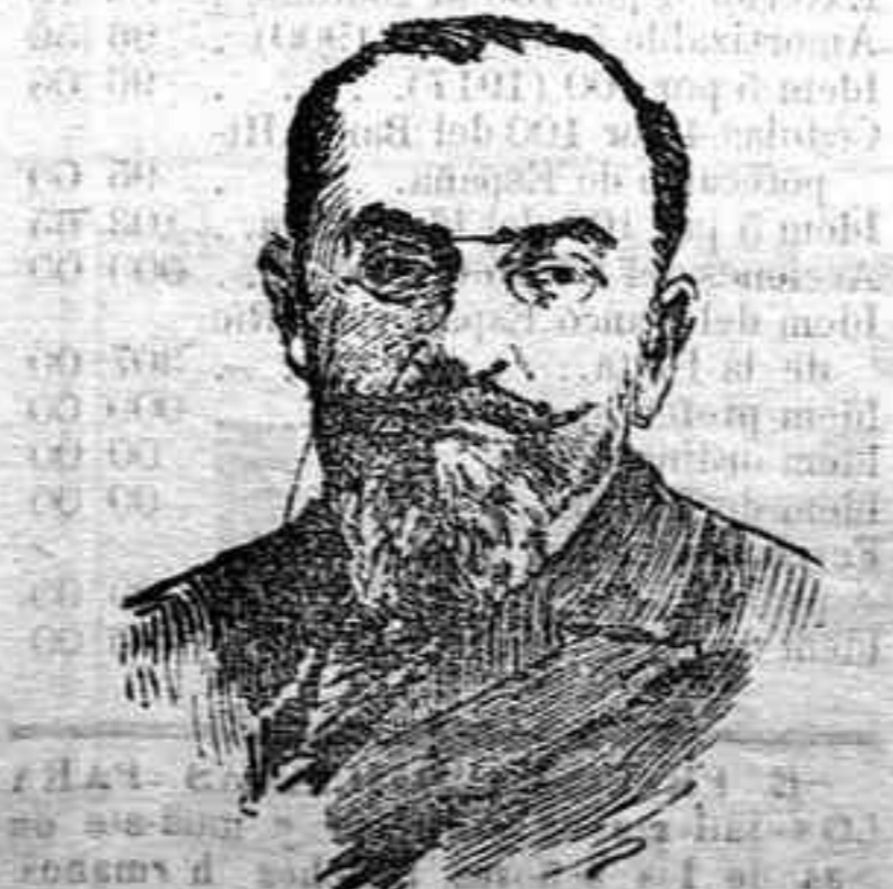
Bourgeois, presidente de la Sociedad de las Naciones