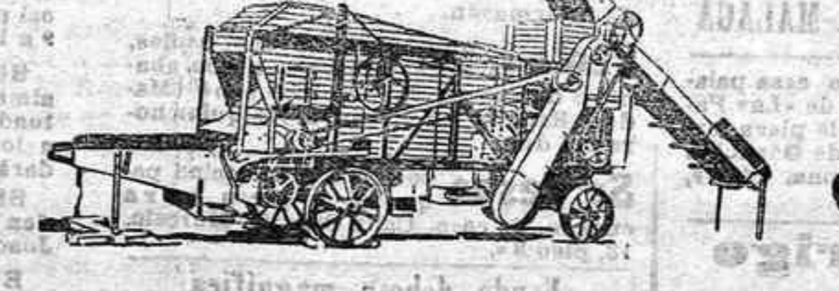
Trilladora TRIUNFO GRANDE.

Para labores grandes.—Trilladoras Lanz de 4 1/2 y 5 pies de ancho, con locomóviles de igual marca. Rendimiento diario de 42 a 46 y de 50 a 55 carretadas.