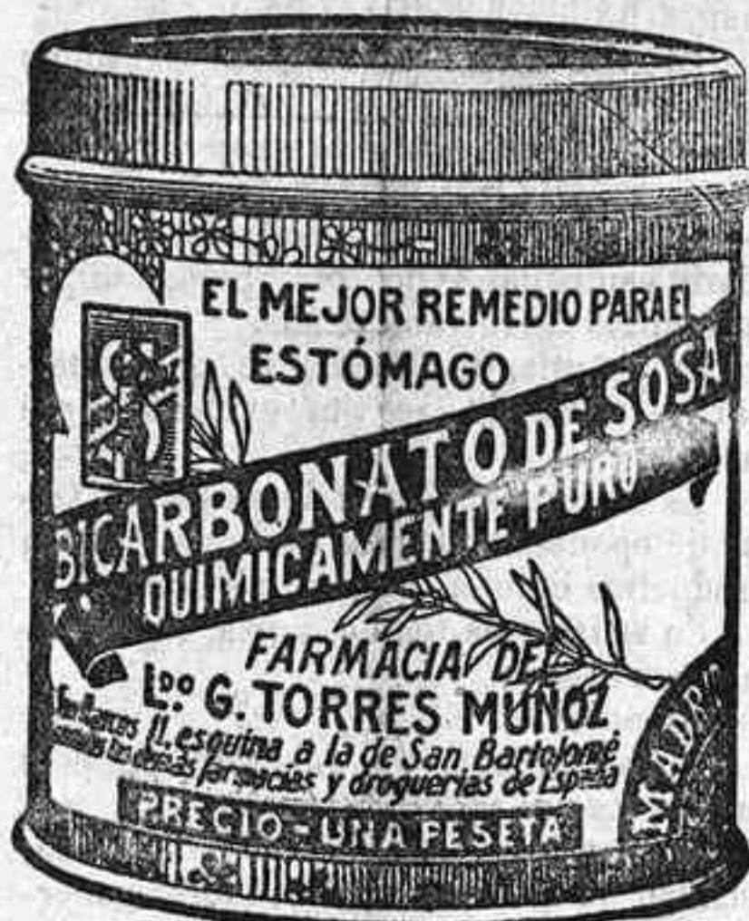
Cuidado con las imitaciones, que son perjudiciales

Se arrienda desde el 24 de Junio próximo un piso bajo, amplio y cómodo, en la calle Rodríguez Sánchez, núm. 4. Razón, San Fernando, 95. 10-6