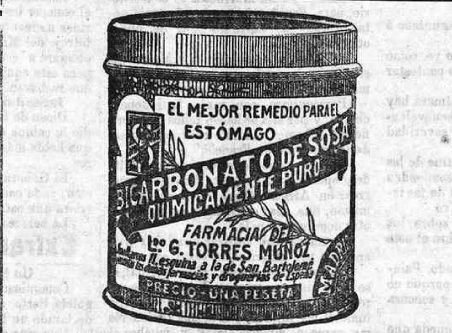
Cuidado con las imitaciones, que son perjudiciales

La Mundial SOCIEDAD ANÓNIMA DE SEGUROS Domicilio: MADRID.—Zarilla, número 11 Capital social. . . . . 1.000.000 de pesetas suscrito 250.000 pesetas desembolsado Autorizada por Reales órdenes de 8 Julio 1909 y 1 Abril 1912 Inscripta en el Registro del Ministerio de Fomento. Efectuados los depósitos necesarios conforme á la Ley de Seguros de 14 Mayo 1908 Seguros mítnos de vida: Supervivencia, Previsión y Ahorro Seguros de ganados: Robo, hurto y extravío Delegación de Córdoba: Huerto de San Pablo, núm. 23 Acordado el desembolso de otras 255.000 pesetas. Aprobado por la Comisaría general de Seguros en 27 de Abril de 1912