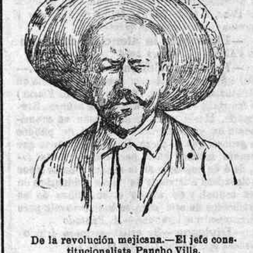
De la revolución mejicana.—El jefe constitucionalista Pancho Villa.