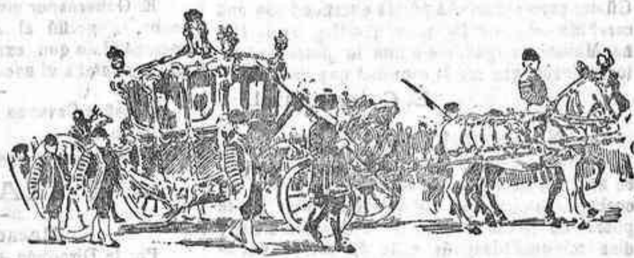
La carroza de los Reyes de Inglaterra, al conducir a éstos a la Cámara de los lores para la apertura del Parlamento

La comitiva de los reyes es santísima cual ninguna, al par que pitoresca, por la diversidad de uniformes que visten los servidores que en ella figuran. Los reyes cifran a sus sienes la corona real y van revatidos con el manto regio, que es de rigor en el solemne acto de la apertura del Parlamento.