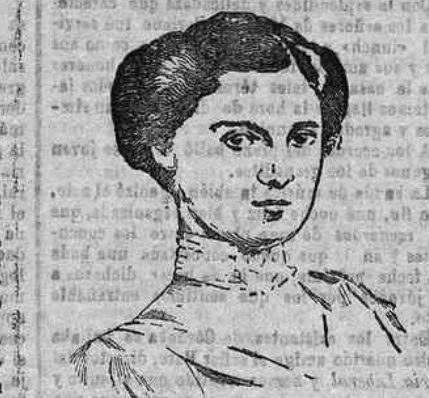
Zita de Borbón, exemperatriz de Austria-Hungría, que en unión de toda la familia imperial se ha internado en Suiza.