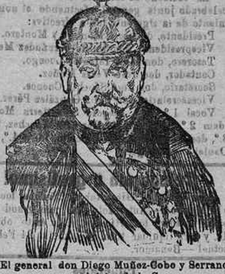
El general don Diego Muñoz-Gobernador y Serrano, nuevo ministro de la Guerra.

La Junta directiva de la Sociedad de Labradores y Ganaderos de Córdoba ha enviado a los pueblos de la provincia la siguiente circular: Ya tendré conocimiento por la circular que se unió del proyecto de Reglamento para la federación de sociedades patronales agrarias, recibida días anteriores, del pensamiento de asociación entre todos los labradores de esta provincia, asociación o sindicación necesaria e indispensable, no sólo para estudiar y llevar a la práctica los medios más eficaces y convenientes para solucionar los constantes conflictos entre el capital y el trabajo, concediendo al obrero en sus aspiraciones cuanto nos sea viable, sino también para la defensa de nuestros intereses comunes, tan desconocidos y abandonados por todos los Gobiernos, segundamente porque aquellos que figuran al frente de la gobernanza del Estado no han vivido la realidad de la agricultura, y sólo conciben sus problemas en la idealidad del tecnicismo.