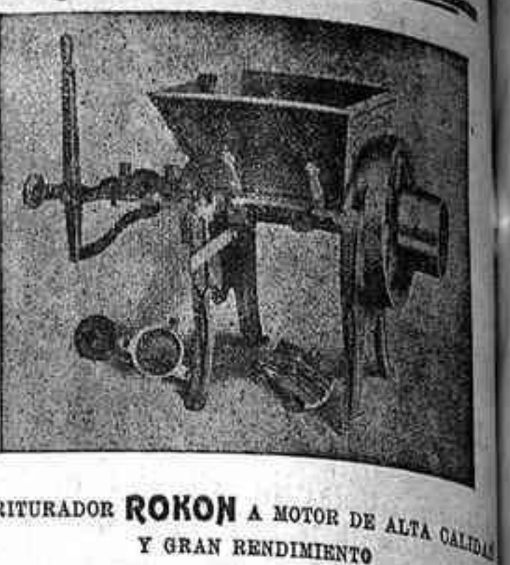
TRITURADOR ROKON A MOTOR DE ALTA CALIDAD Y GRAN RENDIMIENTO

Pidan detalles a Garteiz Hermanos, Yermo y Compañía Córdoba