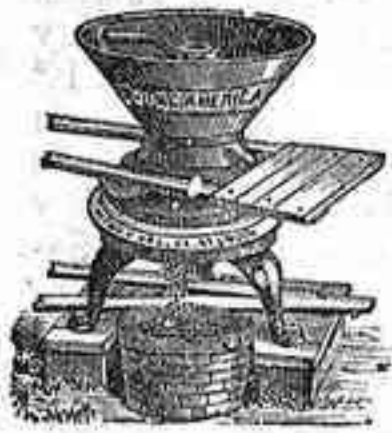
MOLINO AMERICANO PARA CABALLERIA ESPECIAL PARA TRITURAR GRANOS GORDOS

Tenemos también otros modelos diferentes, construcción inglesa para ser movidos a brazo y a motor