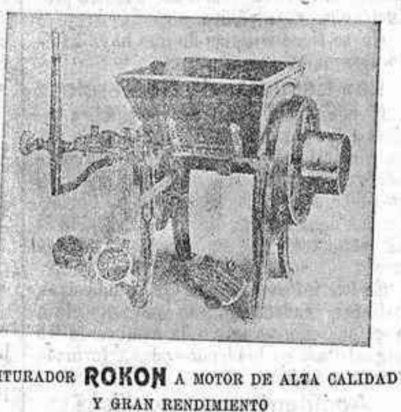
TRITURADOR ROKON A MOTOR DE ALTA CALIDAD Y GRAN RENDIMIENTO

Vendo, Máquina de escribir Remington número 10, carro grandísimo; otra Kanzer, esta la mejor marca conocida como duración y resultado, es la más completa en la escritura, foliador alemán, 6 unidades y romana con estuche, 200 Kilos, Cister, 4.