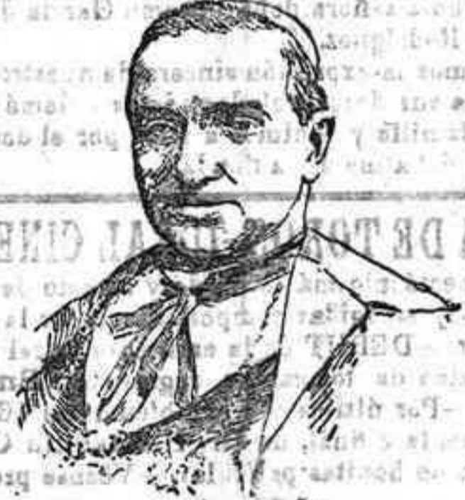
FIGURAS DEL DÍA.—Monsieur Rinaldino, nuncio que fue en España, que se halla gravemente enfermo.

No habiendo más asuntos de que tratar, fue levantada la sesión.