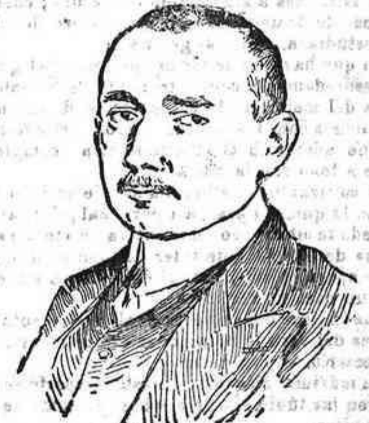
FIGURAS DEL DÍA.—El exministro del Interior Heiferich, nombrado embajador de Alemania en Moscú.