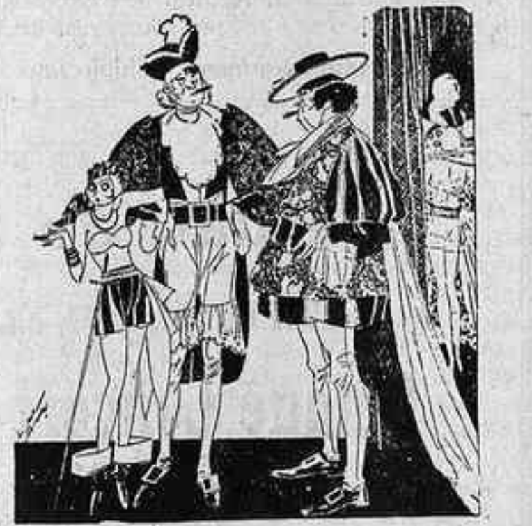
— De què aneu? — De Lluís XVI. — I ca, el que va de Lluís XVI sóc jo! (Life.)