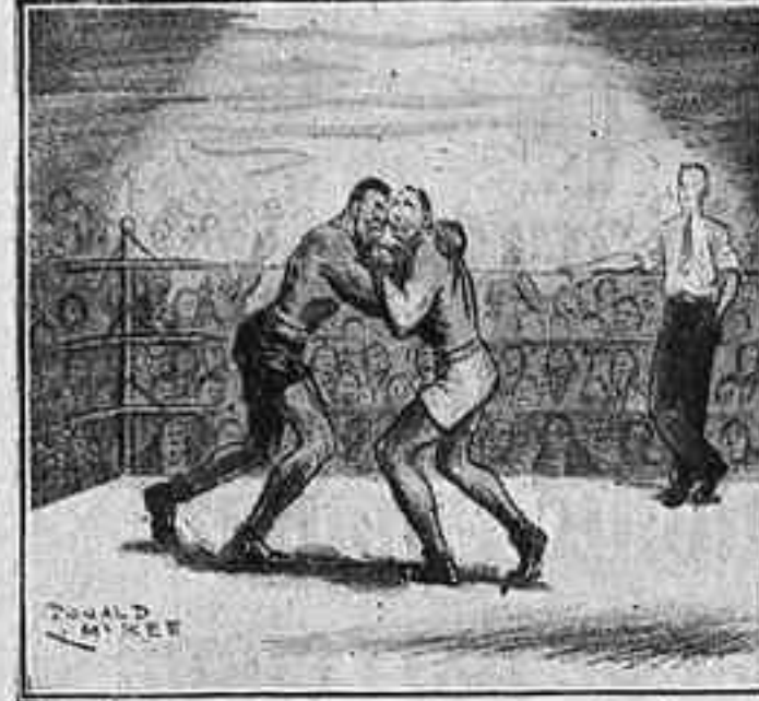
El campió. — Mira'm d'una manera més furiosa i rondina de baix en baix. ¿Que no te'n recordes que fem un combat aferrissat? (Life.)