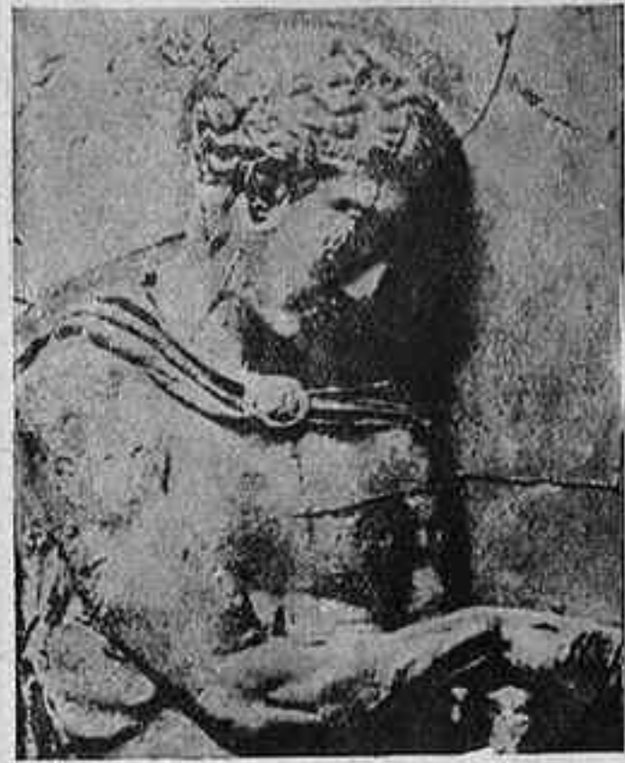
Fragment del fris del Partenon segons el motlle en guix tret en 1801