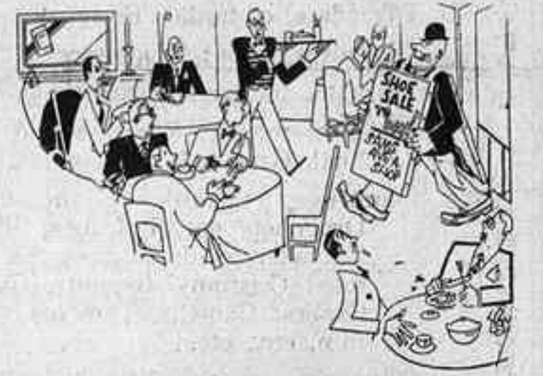
— Perdoni. ¿Es aquí el Publi-Club?