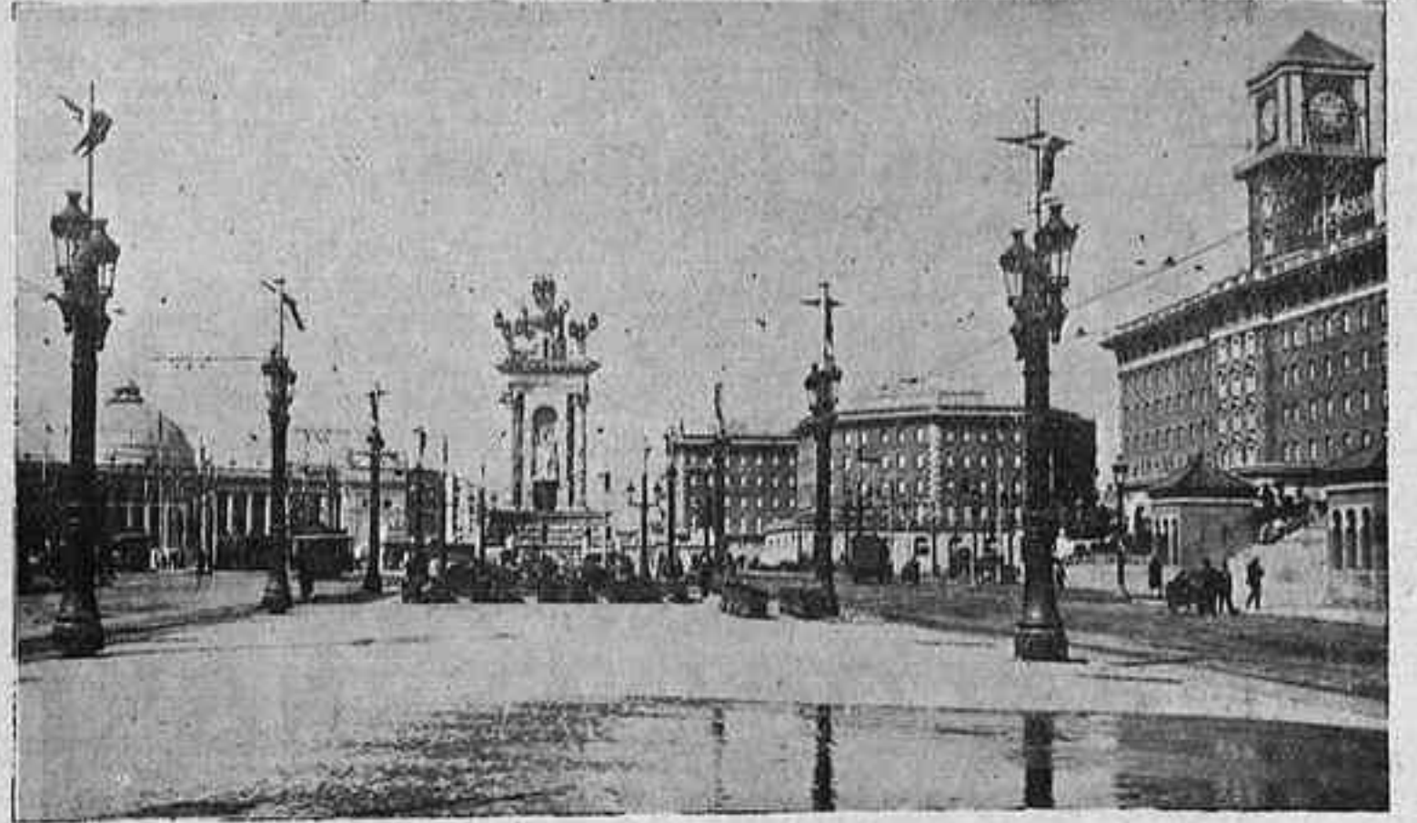
La Plaça d'Espanya

L'entrada de l'Exposició: dues admirables torres i un palau porticat a cada banda. Ho trobem molt ben pensat. Les dues torres — projecte de l'arquitecte Ramon Raventós — són de les coses més reeixides del certamen. Recorden, evidentment el campanile de Venècia: semblant fisonomia, les mateixes arquacions de dalt a baix a les quatre façanes i el mateix acabament piramidal; però això no vol dir que sigui un plag, car és — i ben afinada — una assimilació. Per dir-ho breument: Raventós ha catalanitzat dignament una solució italiana.