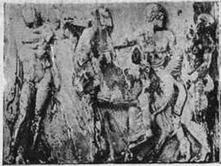
L'obra de 128 anys sobre la processó de les Panatenees

gent d'aquells països deixats de la mà de Déu molt més a prop d'«elginitzats» que no pas capaços d'«elginitzar» ningú. Nosaltres, que desitjaríem per a la nostra pàtria una antipatia tan gran com la que inspiren els «elginitzadors» i no la simpatia — quasi bé la darrera cosa que es pot negar a un captiu — que desperten els «elginitzats», érem ben lluny de considerar la feta de Lord Elgin — i menys tenint en compte les circumstàncies que hi concorren i la situació llavors dels dos països — sota la mateixa llum que els seus bescantadors, encara que veïem força més uns possibles subjectes per haver de sofrir una «elginització» o altra que no uns probables agents per poder practicar-la. Creïem que, lluny per lluny, per un ciutadà corrent d'Europa sempre és més a la vora Londres que Atenes, i que, per altra banda, sempre estaríem segurs de poder contemplar al British Museum els frisos del Partenon — per bé que el lloc no fos tan avinent per fer-hi fantasies coreogràfiques —, mentre que al Partenon mateix era ben possible que ben aviat no en poguéssim veure tros ni bocí.