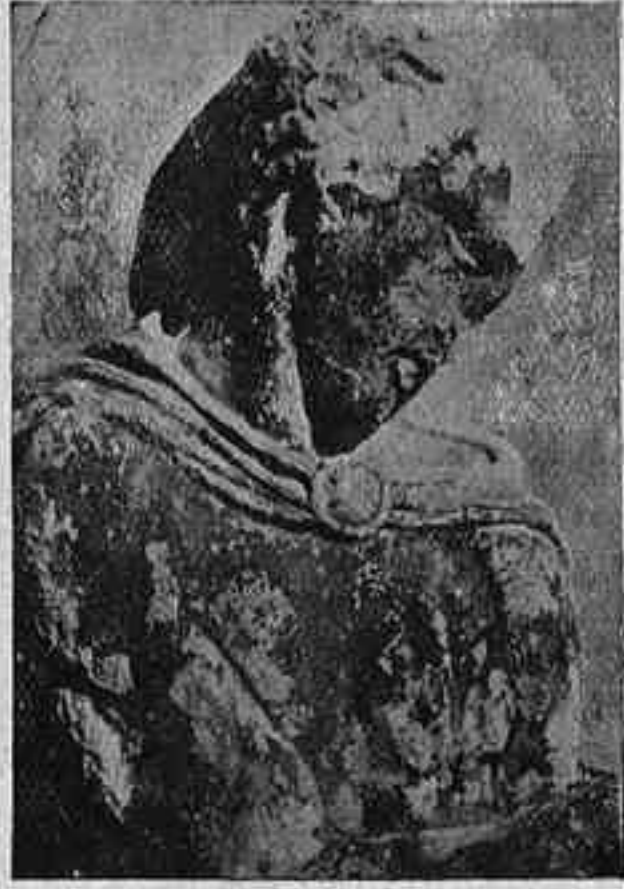
Estat del mateix fragment en l'actualitat

sigui de passada, no hi va perdre pas massa —, i el nom d'«elginisme» aplicat d'una manera dura i bon tros sense discerniment a tot cas d'una obra que per una o altra causa sortia del país, i fins del lloc, que la vegé néixer.