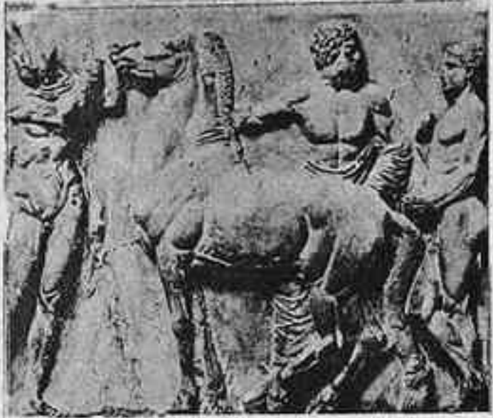
Part de la processó de les Panatenees tal com Lord Elgin l'emmolllà

No hi ha dubte que encara ha d'haver-hi qui no s'haurà convençut que val més una «profanació» o un «robatori» intel·ligent i respectuós que no deixar enrunar-se i per-