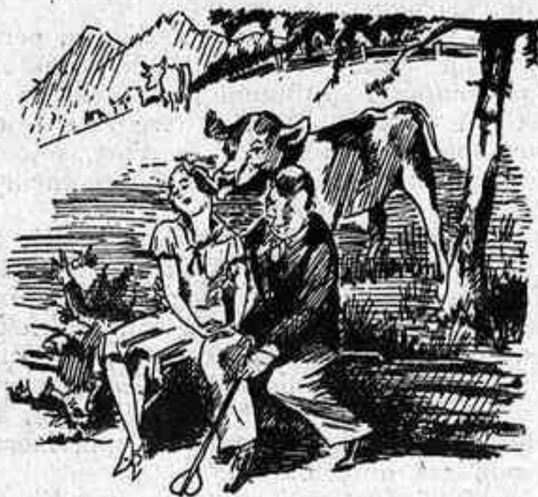
— Eduard, em sembla que exageres. (L'Illustré, Berna)

Hom ha donat la xifra de 15 a 20.000 aficionats anglesos a la recepció d'imatges per ràdio, xifra potser un xic massa optimista.