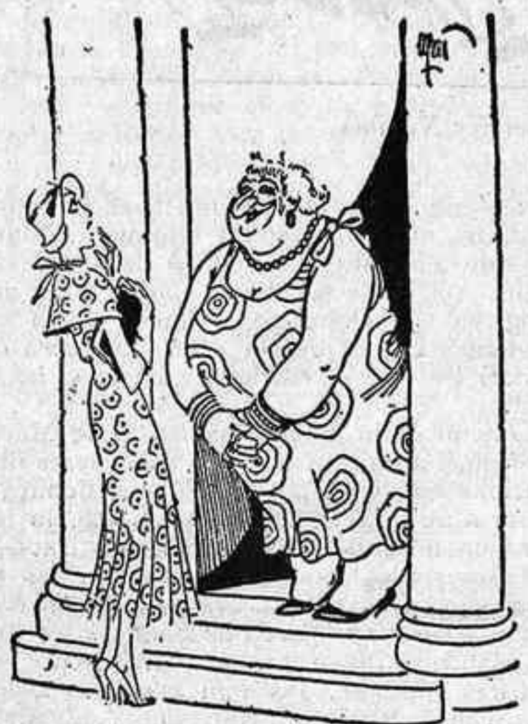
— La directora de l'Institut de Bellesa? — Jo mateixa, senyora.

La primera sortida de Vinyes causà en el públic una impressió falaguera. Malgrat una emoció fondíssima que no esvalà en tota la nit, digué el novell tenor molt regularment la part no gaire extensa del segon acte i cantà el quart amb veu clara i dicció perfecta. El duo amb la triple serví especialment a Vinyes per a palesar la seva preparació.