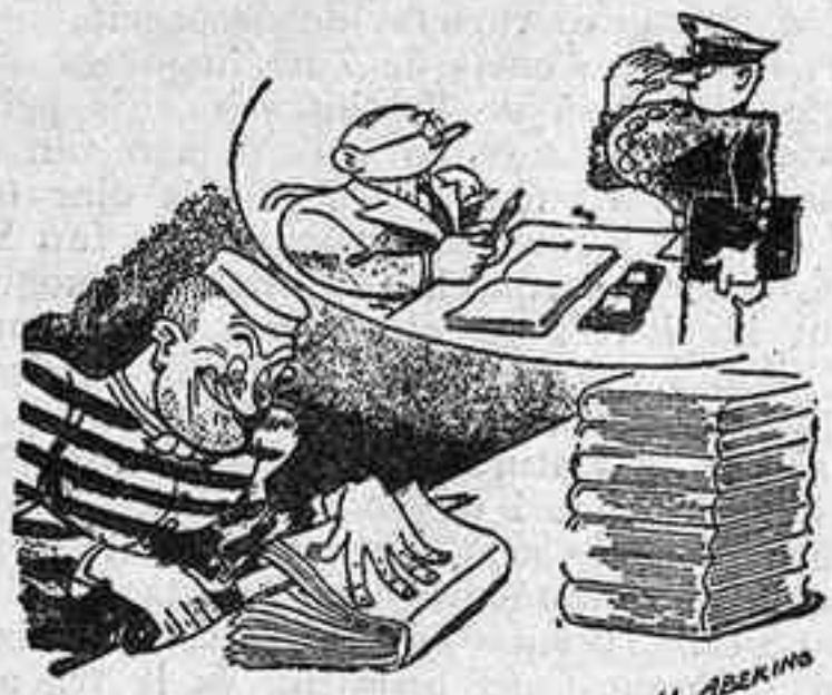
—Senyor director, quina ocupació donarem a Jack el Destripador que ha ingressat avui? —Que talli els llibres de la biblioteca del penal. (Der Lustige Sachse, Leipzig)

que han de prodirar-li. Contra això no han pogut ni les mesures de defensa de caràcter jurídic que han volgut prendre els editors per a salvar els seus discos. S'han entaulat procediments judicials, s'estipula la prohibició de radiació, però el resultat no ha estat prou eficaç i la ràdio ha infortunat als discos un greu perjudici convertint en una lluita el que podria ésser un motiu de convivència profitosa per a ambdós mitjans de difusió musical.