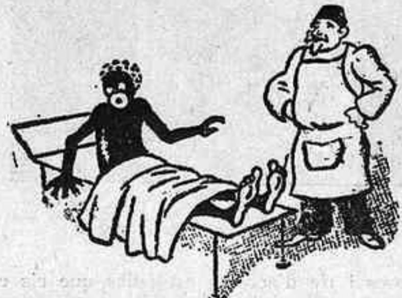
CIRURGIA INESTETICA —Però què ha fet, senyor doctor! M'ha cosit amb fil blanc! (Péle-Méle, París)