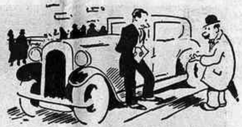
AL SALO DE L'AUTO —Em... sí... per 75.000 pessetes està bé. Doni'm un prospecte. (Gringoire, París)