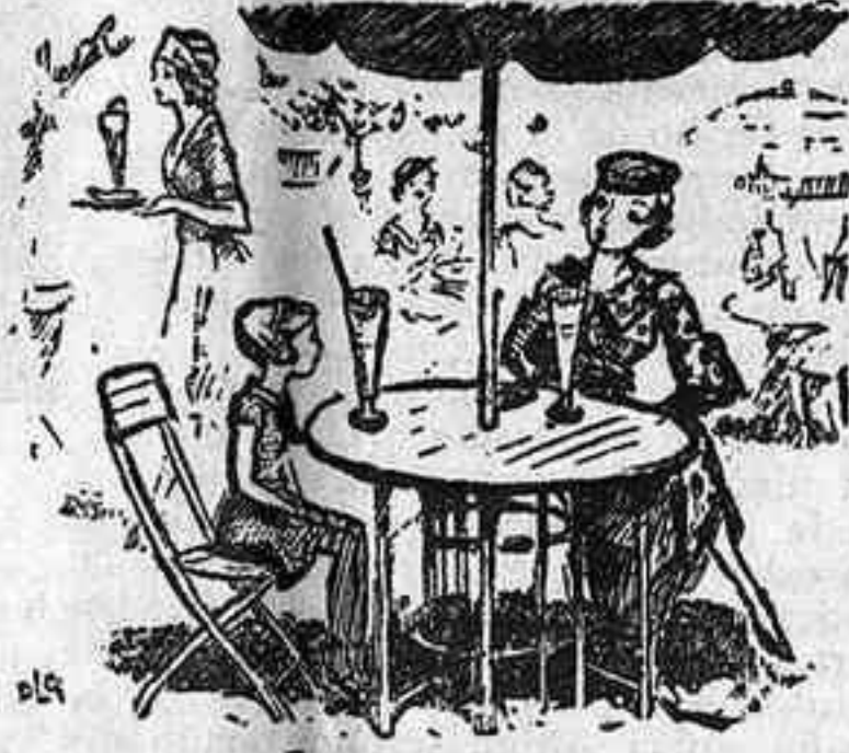
—Què faig, mamá? Poso la copa a terra, m'enfiso a la cadira o no em prenc el refresc? (The Humorist, Londres)