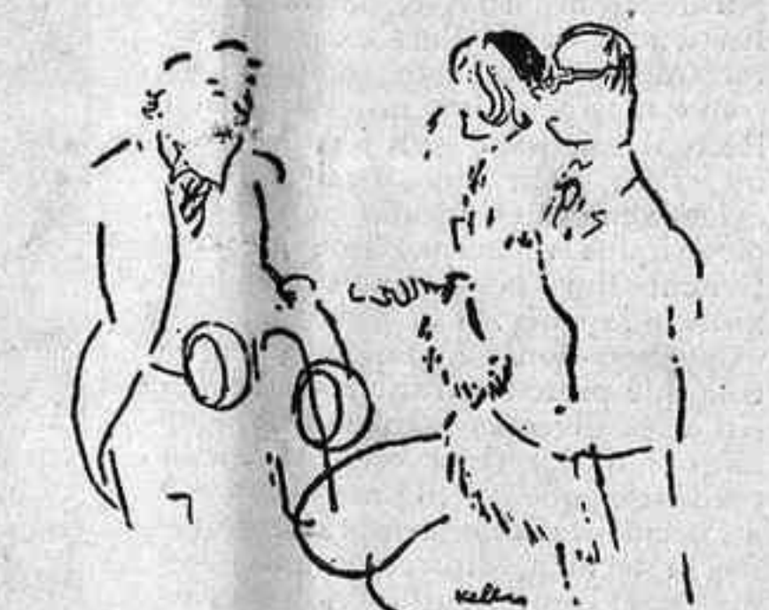
—Vull un auto extraordinari, diferent de tots els altres... —Entesos. Vostè vol un cotxe i pagar-lo al comptat. (Kölnische Illustrierte Zeitung, Colònia)

En aquests temps que els músics s'han vist foragitats dels salons de cinema per l'adveniment del sonor, podien tenir, amb el desenvolupament que ha tingut la ràdio i l'augment d'hores d'emissió, una petita compensació no sols pel major augment del personal fix de les orquestres, sinó també un lloc d'exhibició per a les petites agrupacions que coneixen la música, frívola generalment, que desfilen periòdicament pels estudis.