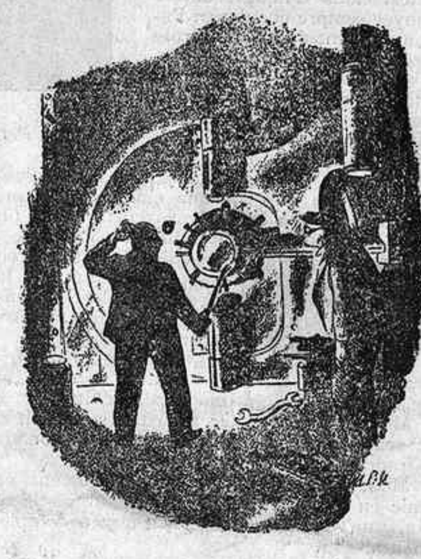
TOT CANVIA —Maleitiga! Aquesta gentussa deuen haver canviat la combinació de la caixa des de quan jo era director. (The New Yorker)

L'eficàcia de la publicitat en el F. C. METROPOLITA de Barcelona, la demostra el fet que és el mitjà de propaganda utilitzat per les Cases més importants de tots els rams.