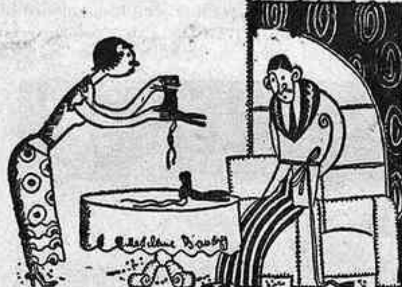
ESTALVIS —Et faré arreglar aquestes sabates. Els cordons encara són bons. (Le Petit Journal, París)