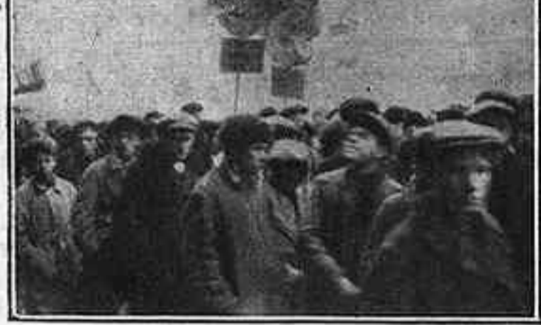
La manifestació del 7 de novembre

truïda a mitjans del segle passat), capaç per a 4.000 persones. Té sis pisos i com que està decorat en vermell i daurat, recorda una mica el nostre Liceu.