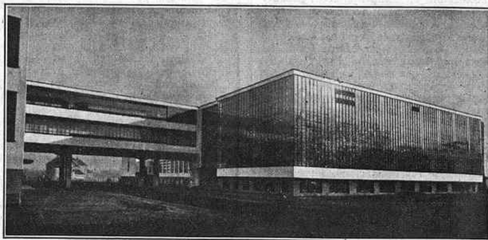
Bauhaus de Dessau (Gropius, arquitecte)

L'arquitectura tradicional té la seva verbençió, la seva expressivitat, la seva sen-