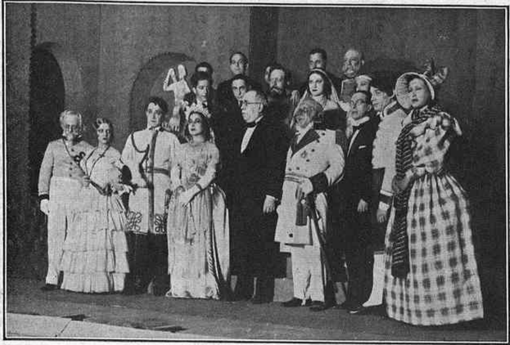
L'autor de «La Corona» voltat dels intèrprets

els elements amb què compta l'autor en emprendre la seva obra, la manera d'èsser i les circumstàncies en què es troba cada personatge, les coses es succeeixen d'una manera fatal i inevitable. No hi ha cap dels protagonistes de La Corona que obri de la manera que obra per caprici de l'autor, per la conveniència de l'argument, per provocar una escena, per justificar una situació absurda. Tot passa exactament tal com tenia de passar.