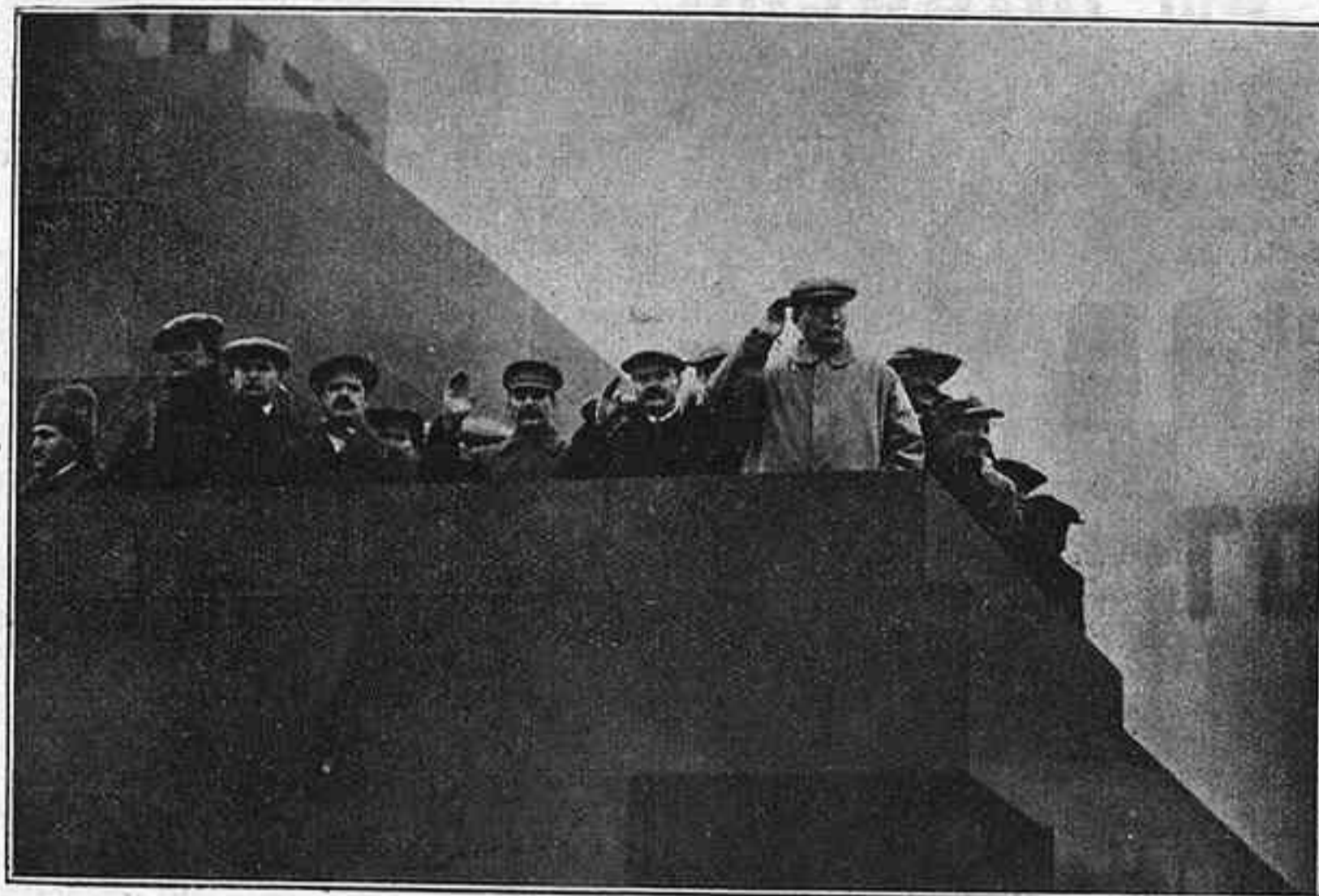
«Sobre la tomba de Lenin, en una mena de terradet, hi ha el Govern»

Si el caràcter del poble ja es presta a aquest «teatre de masses», a penes cal dir