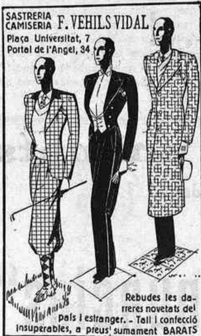
Rebudes les darreres novetats del País i estranger. Tall i confecció insuperables, a preus sumament BARATS