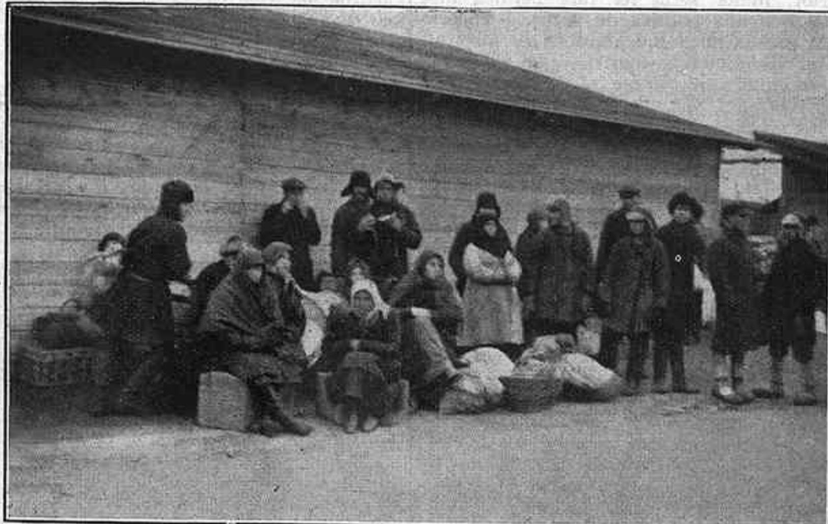
«Colles que hom veu en totes les estacions d'enruncament ferroviari»

Darrera l'exèrcit regular, ve la policia. Entre ella, els batallons de la O. G. P. U. passen rígids com un sol home, units, compactes, amb una disciplina sols comparable