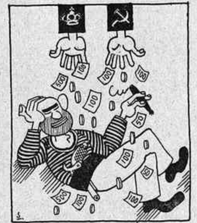
Tirant de beia

S'assegura que el senyor Companys li enviarà una lletra dient-li que si se'n fa gaires més, el dia que les turbes les hi vulguin tornar a cremar i ell—el senyor Companys—torni a ésser governador de Barcelona—probablement haurà plogut força fins aleshores—no li promet que es vegi en cor d'enviar-li suficient nombre de policia per evitar que les hi cremi, com va estar a punt de succeir-li l'endemà de la proclamació de la República, segons explica en Paquet Madrid en aquell llibre Ocho meses y un día en el Gobierno Civil de Barcelona que vostès probablement no han llegit, i nosaltres —sense el probablement—tampoc.