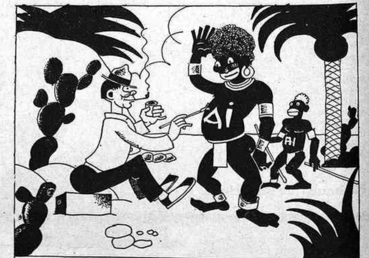
Com es fa un adherent, a Bata