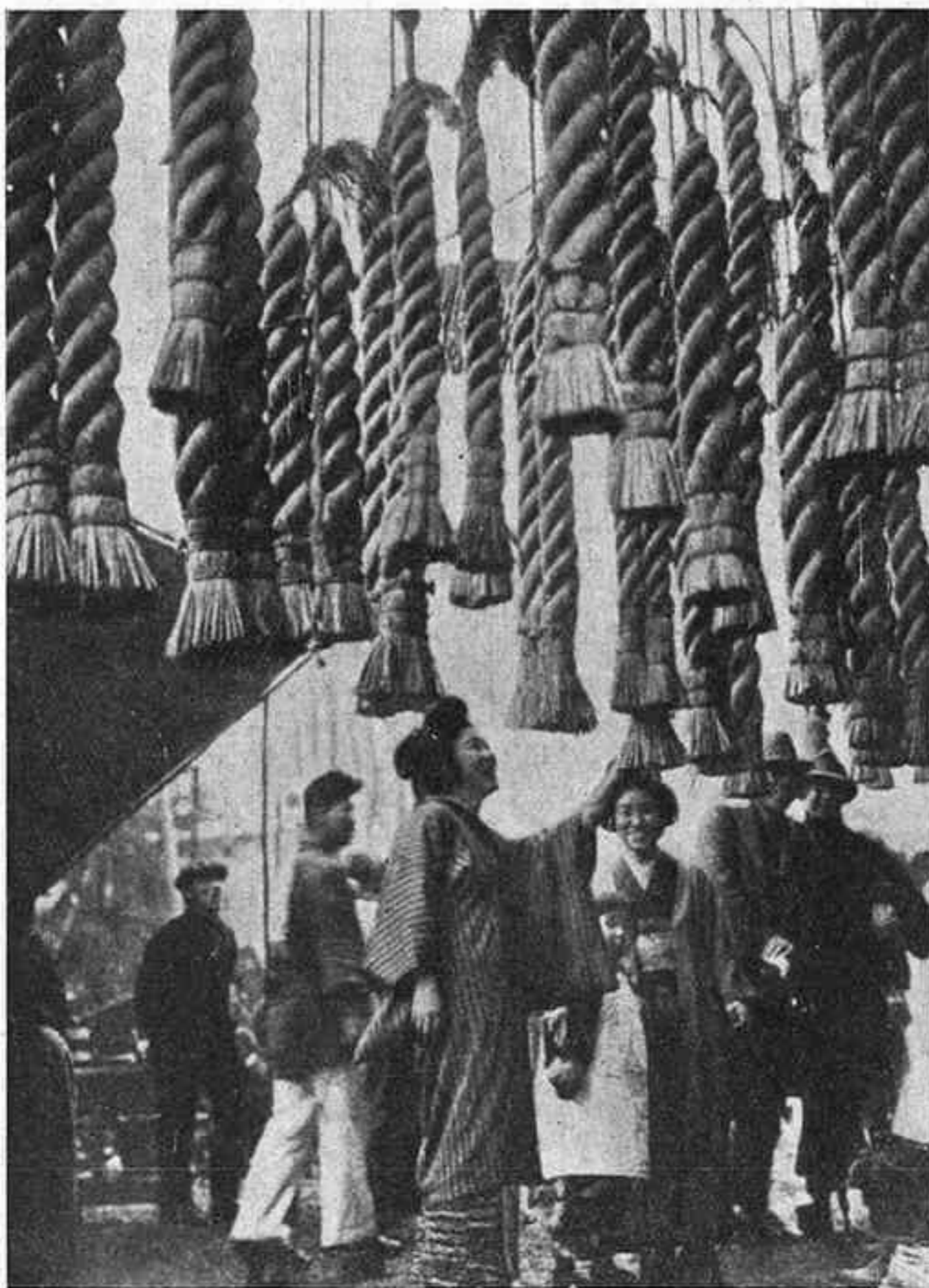
Cal no tenir massa confiança en l'acabament del conflicte oriental. Com es pot veure, els japo esos encara tenen corda per estona.