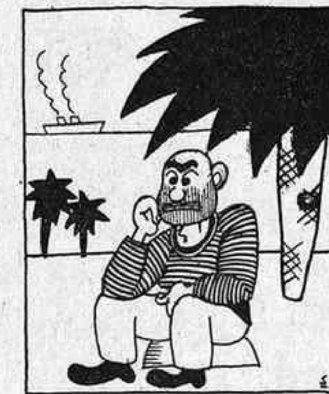
Tirant de Bata

El dia mateix que es celebra, va allà on podia el Congrés de l'Esquerra, el senyor Macià, atent a tot, tingué notícia que al Palau de la Música Catalana Jean Cocteau i Darius Milhaud presentaven «Le Pauvre Matelet». El senyor Macià hauria pogut donar l'excusa del fred o bé del Congrés o bé de totes dues coses alhora, ja que anaven juntes. I bé, cosa que «La Publicitat» va silencià, el senyor Macià, deixant per un moment de banda la seva significació d'home de partit, sempre al servei de les classes humils, acudí al Palau amb la seva família i el seu secretari: —Anem-hi—va dir— a veure què podem fer per aquest pobre noi. I dirigint-se a l'Alcalde: ¿Què us sembla si li prometísim un barquet i una mica de mar perquè pogués anar navegant?