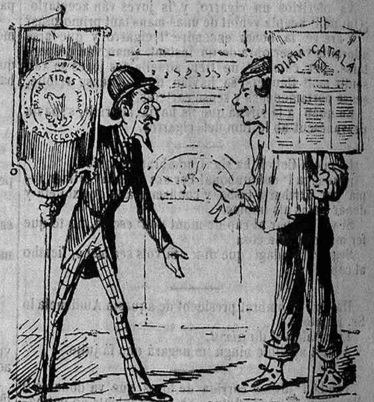
ENTRE DOS CAMPEONS: Ay, ay! Francament jo m creya cosa de llors y de llurs. —Donchs s'equivoca: era cosa de qui juga no dorm.