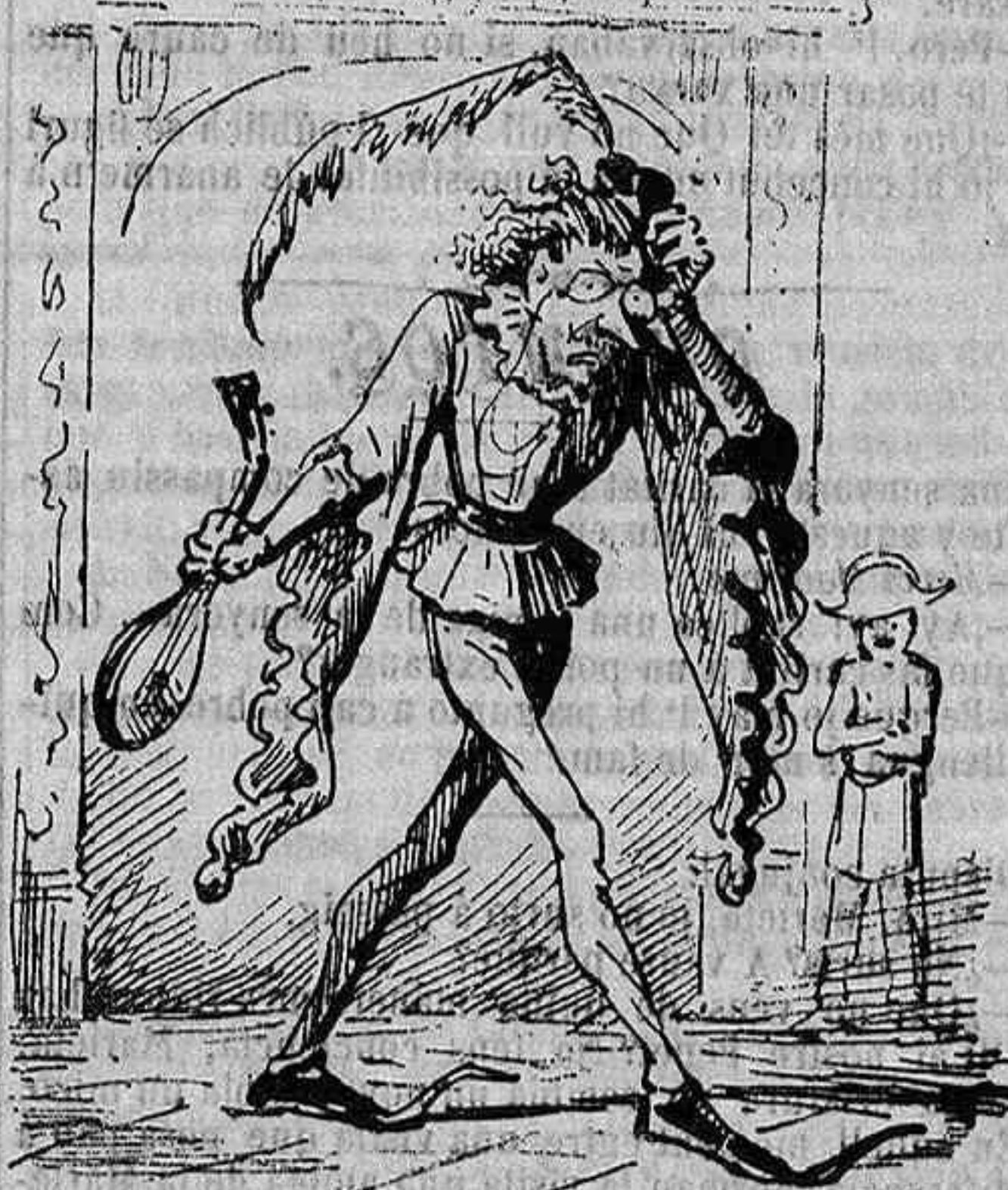
LO PARTIT VENSUT: Qui ha vingut son las maynades de la Nova Mercé, los trompets y fins les indomables legions dels sagarretes! ...