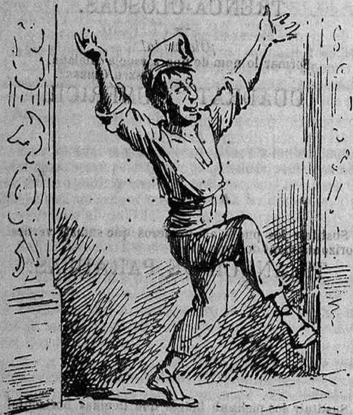
LO PARTIT VENCEDOR: Malgrat 4 e esforços del enemich, han vingut las maynades populars, y hem guanyat... ¡Visca 'l nostre almirall!