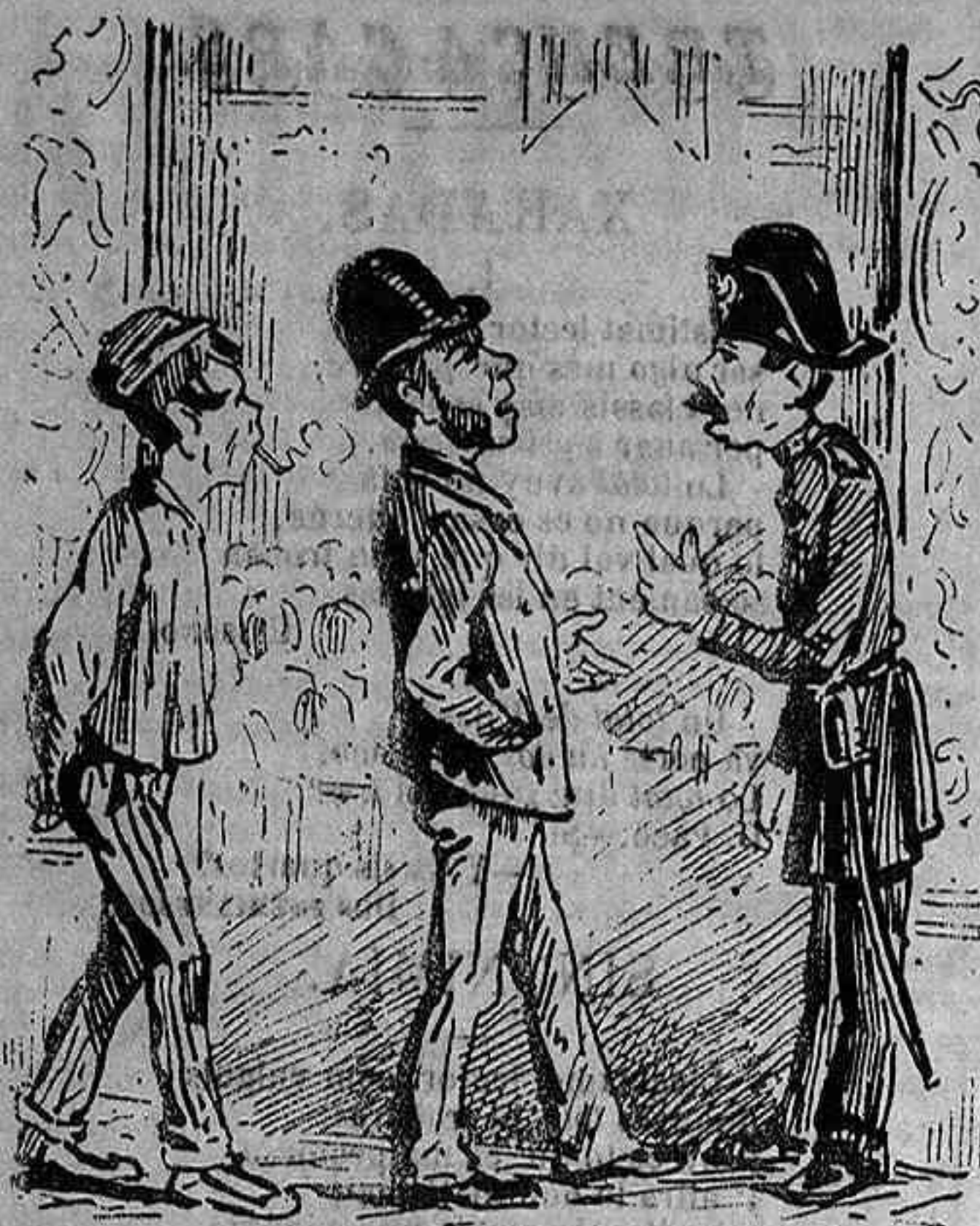
A L' ENTRADA: —¡Alto! Vamos á veure si es catala. Fassa 'l favor de dir: «Setze jutjes menjan fetje de un penjat.»