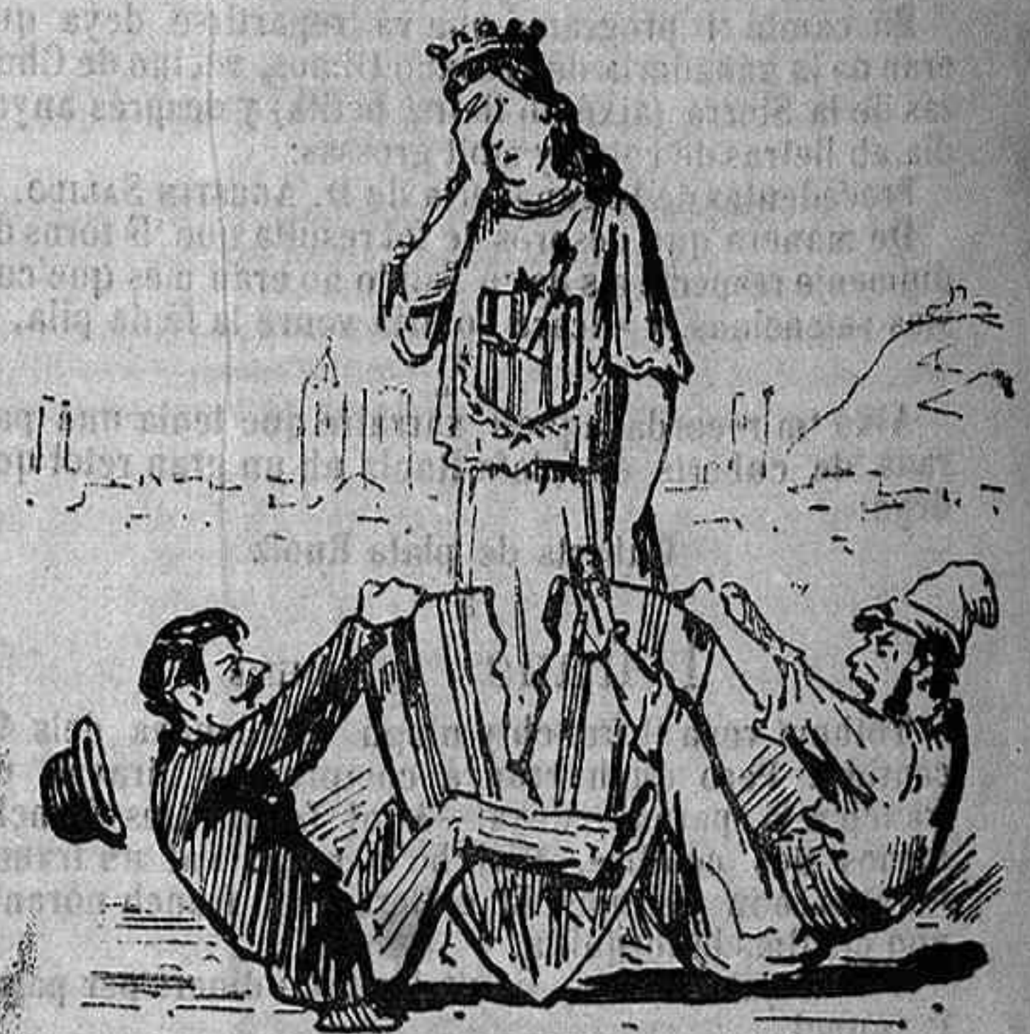
LA SESSIÓ DEL DIMARS:

Béhen d' orxata uns quans gots perque ja la sanch los pica. Seguinlos: d' aquí una mica ja veuréu quins esquellos!