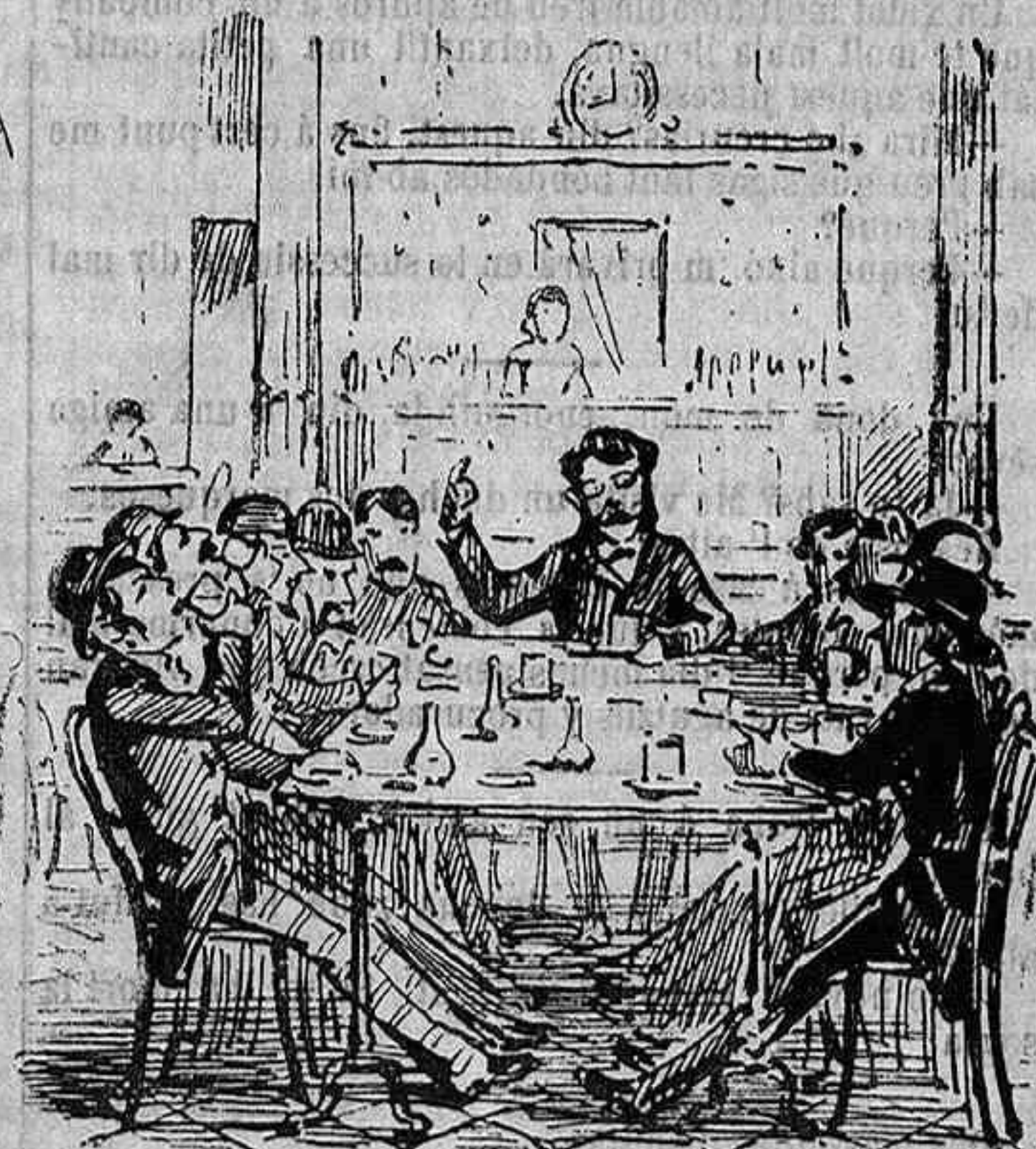
AL CAFÉ DE PELAYO:

Com á prova de alegria aquest se gastan la plata fent pa y trago y serenata. ¡Sant Jordi y santa Maria!