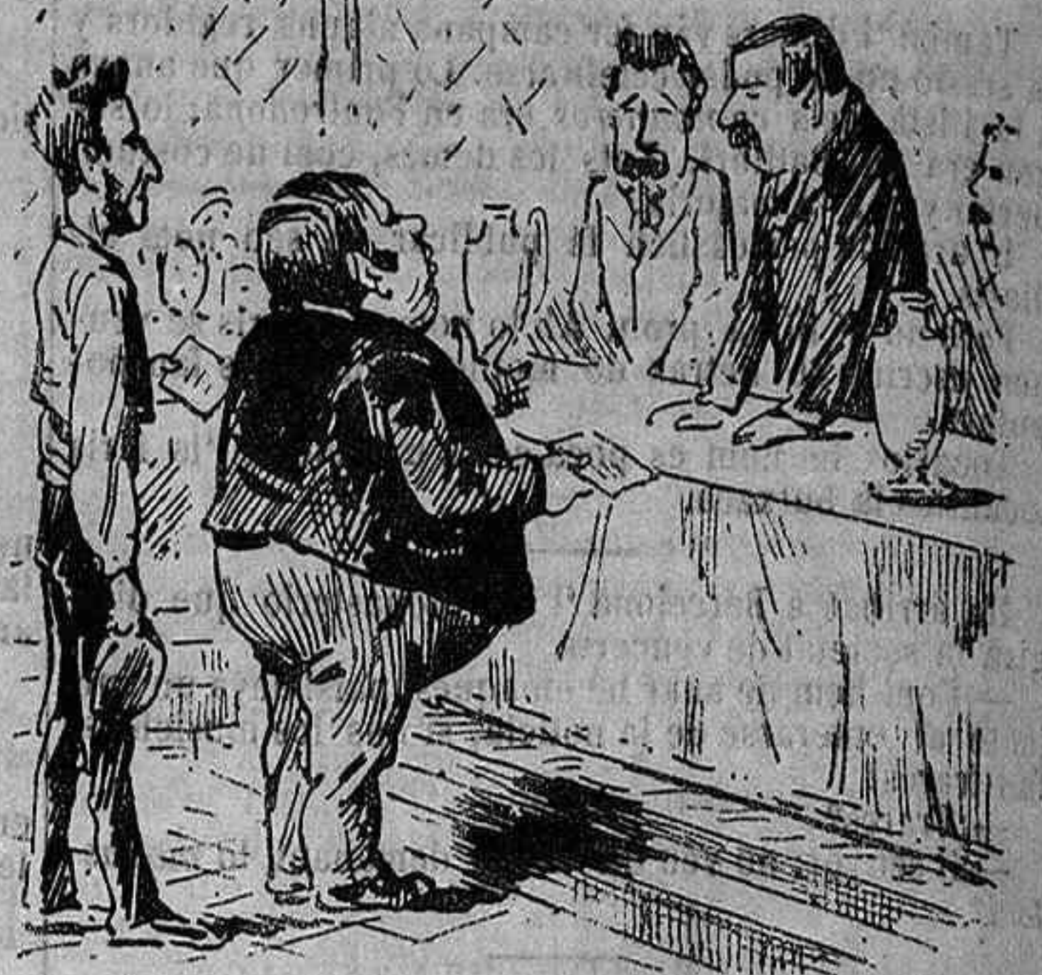
DURANT L' ELECCIÓ: —Y un servidor que no vota? —¿Cóm se diu? Jaume Pilota. —¡Pitota!... ¡Quina trifulgal! Per mi voti tant com vulga.