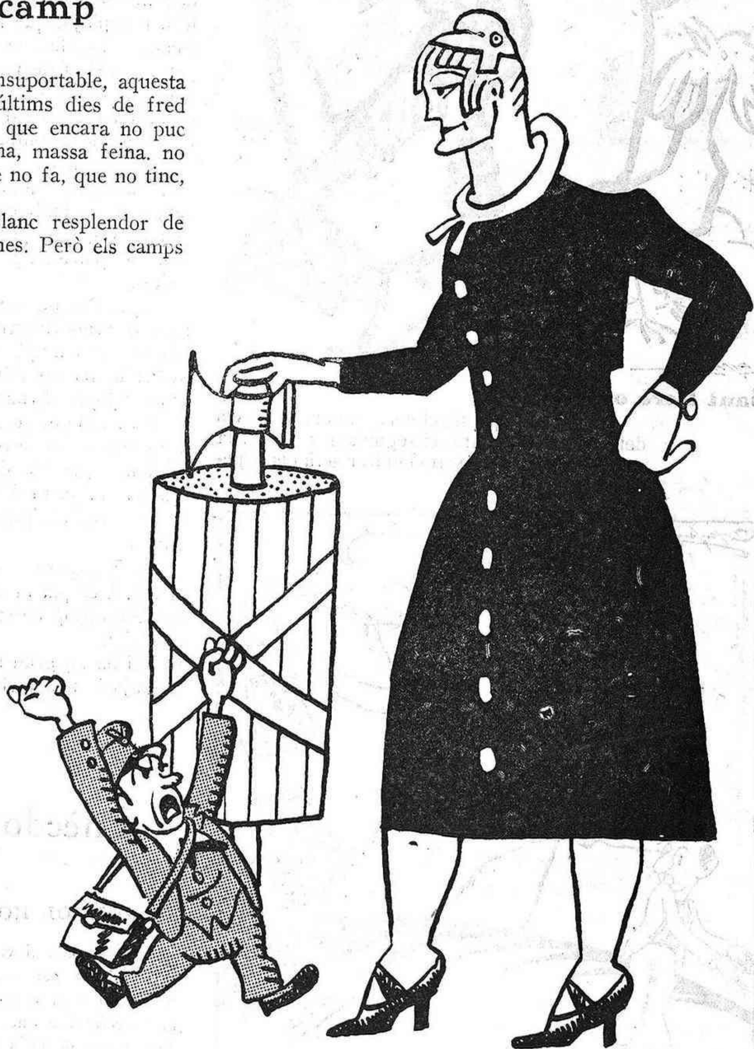
La vaga dels tramviaris

Hi ha unes calaixeres isabelines, de fusta negra, o negra amb aplicacions de color canyella. Damunt aquestes calaixeres hom veu coses velles, ingènues, delicioses: una