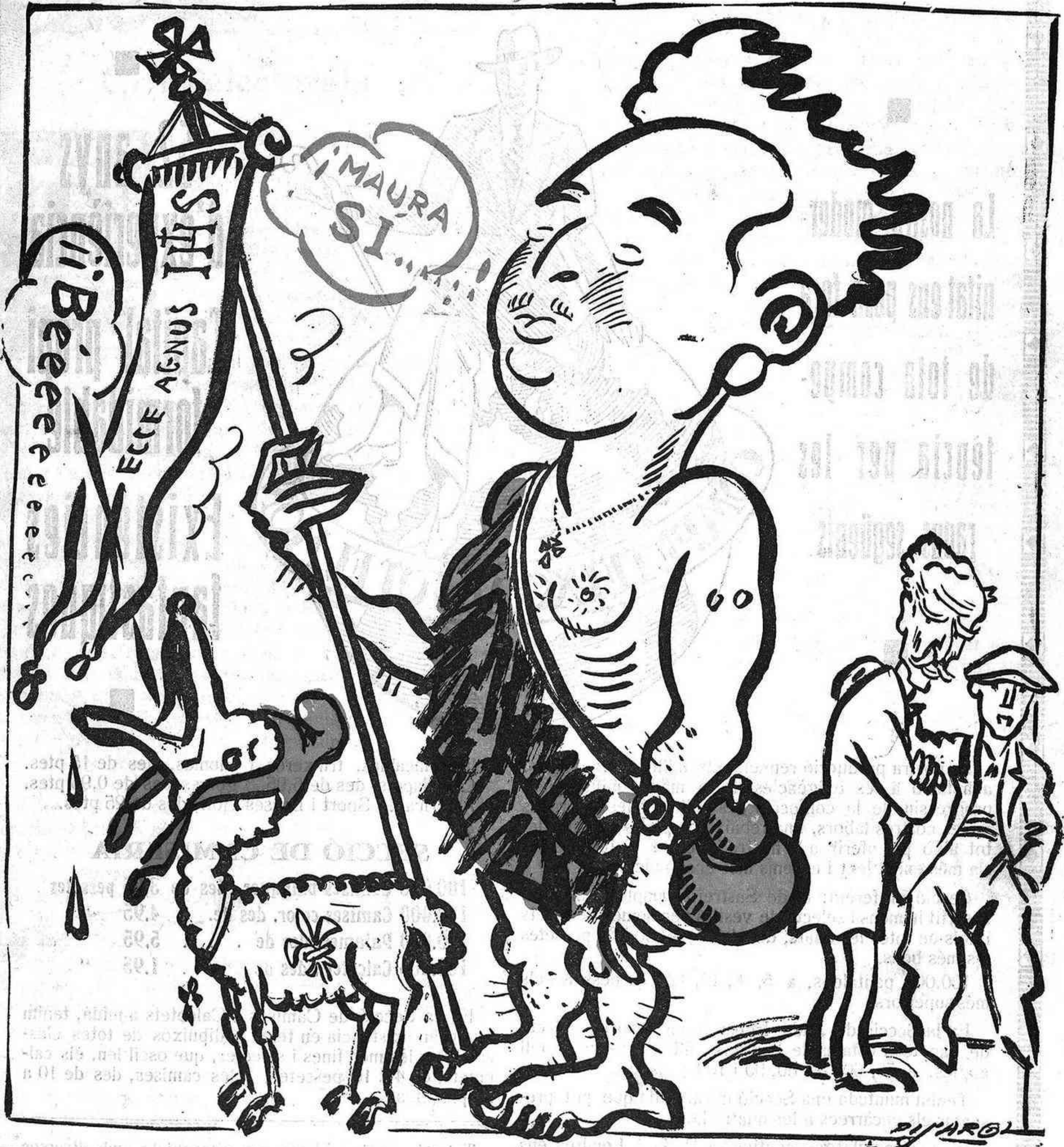
El Sant Joan d'enguany

—L'han fet President provisional de la República; però amb aquesta calor se'ns ha estovat massa