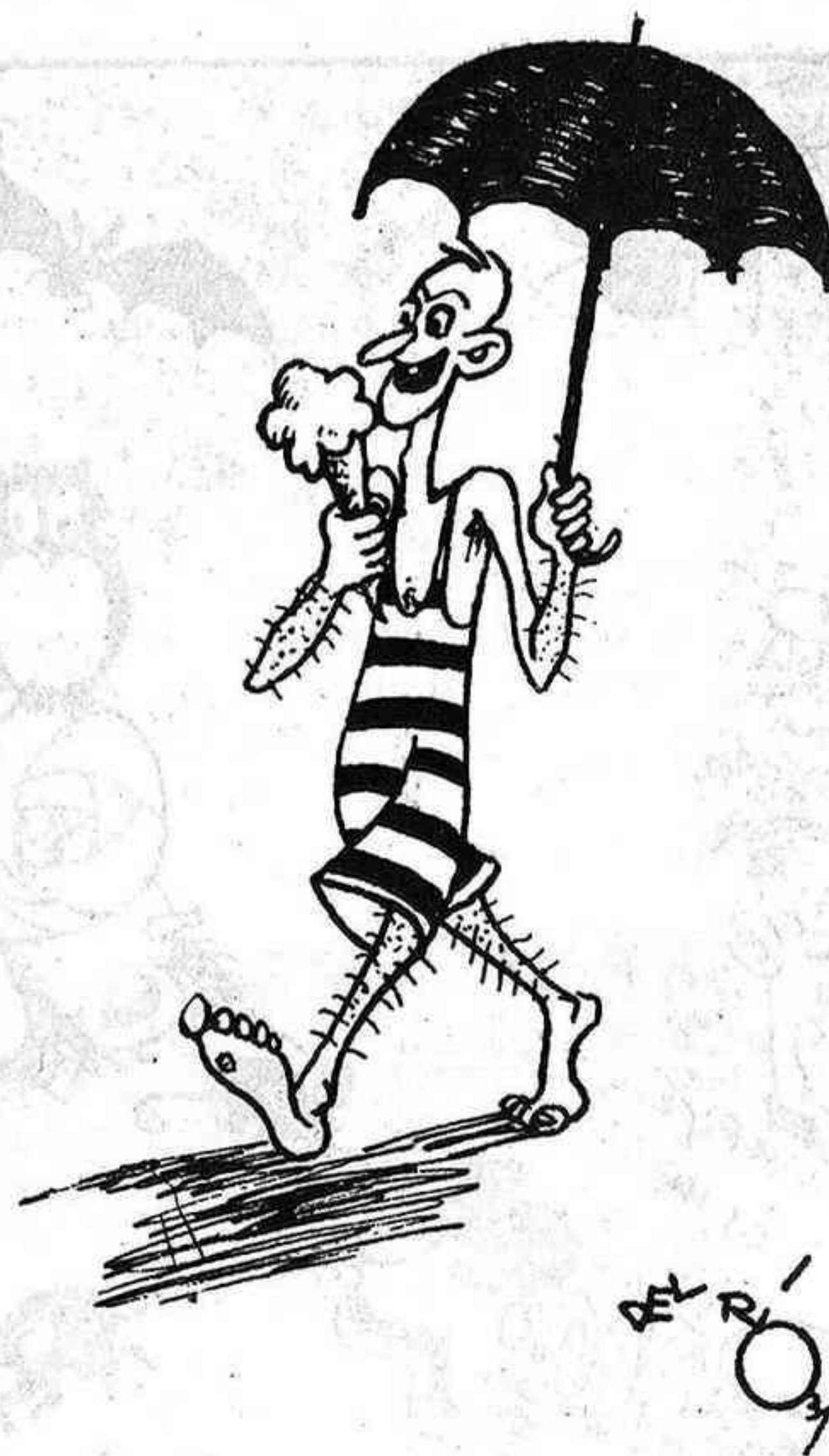
Uniforme que proposem als nous diputats... si la calor apreta com ara