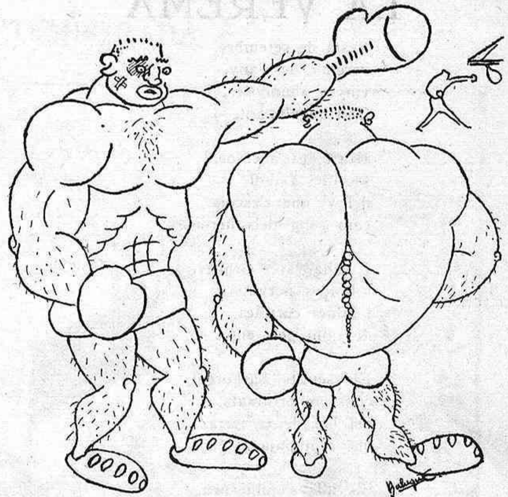
EL SAGRAT COP DE PUNY

—Veus? Aquell és un pes "ploma" que es vol fer passar per pes "gall".