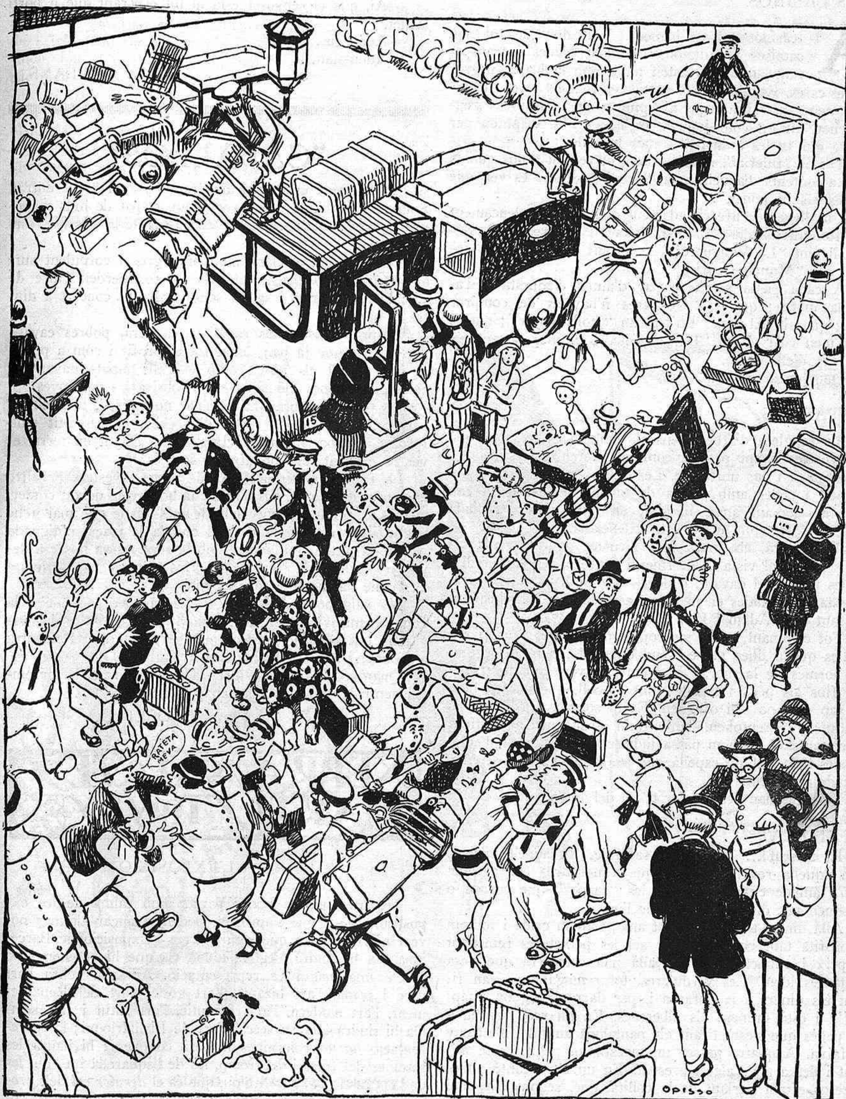
La tornada de l'estiuejant