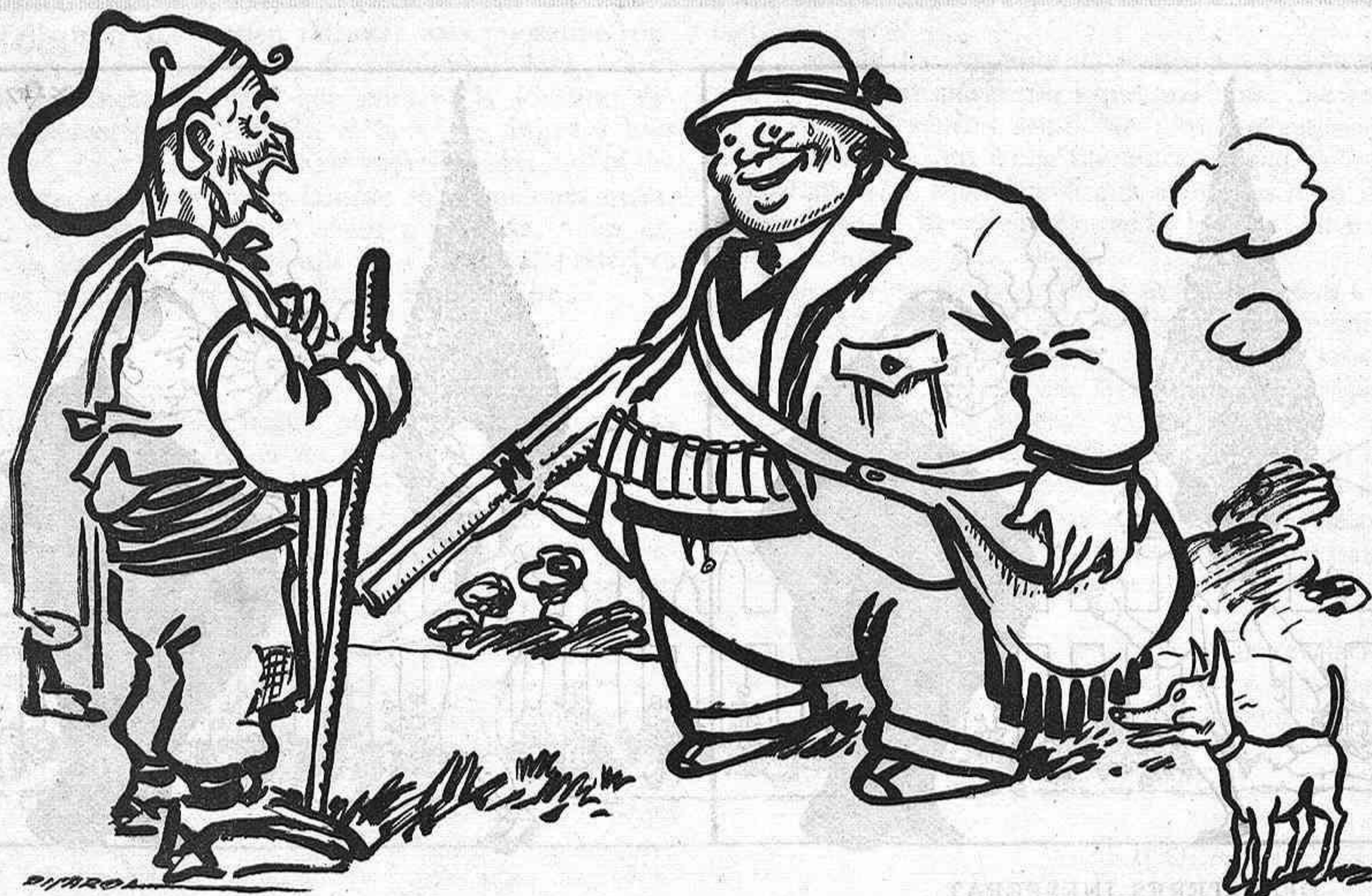
UN QUE NO EN CAÇA CAP

—Es horrorós, senyor! Per despullar-lo, necessita quatre camàlics; allò no és un marit: es Montgolfier!