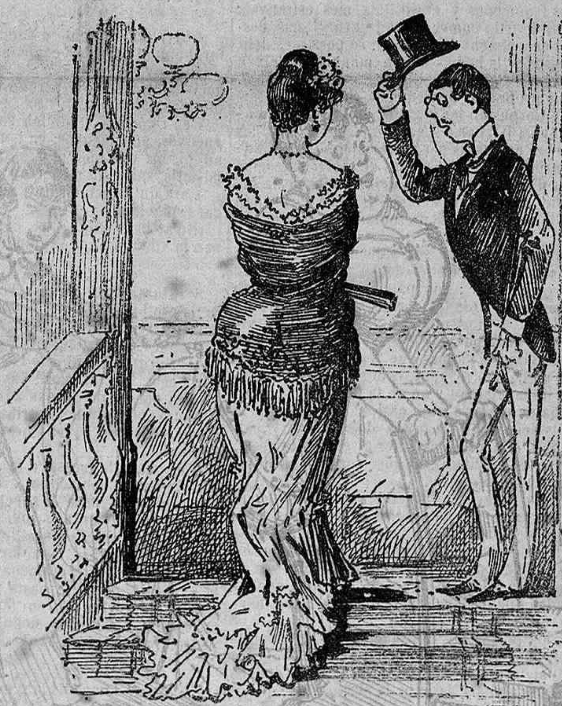
Al vespre al Teatro.