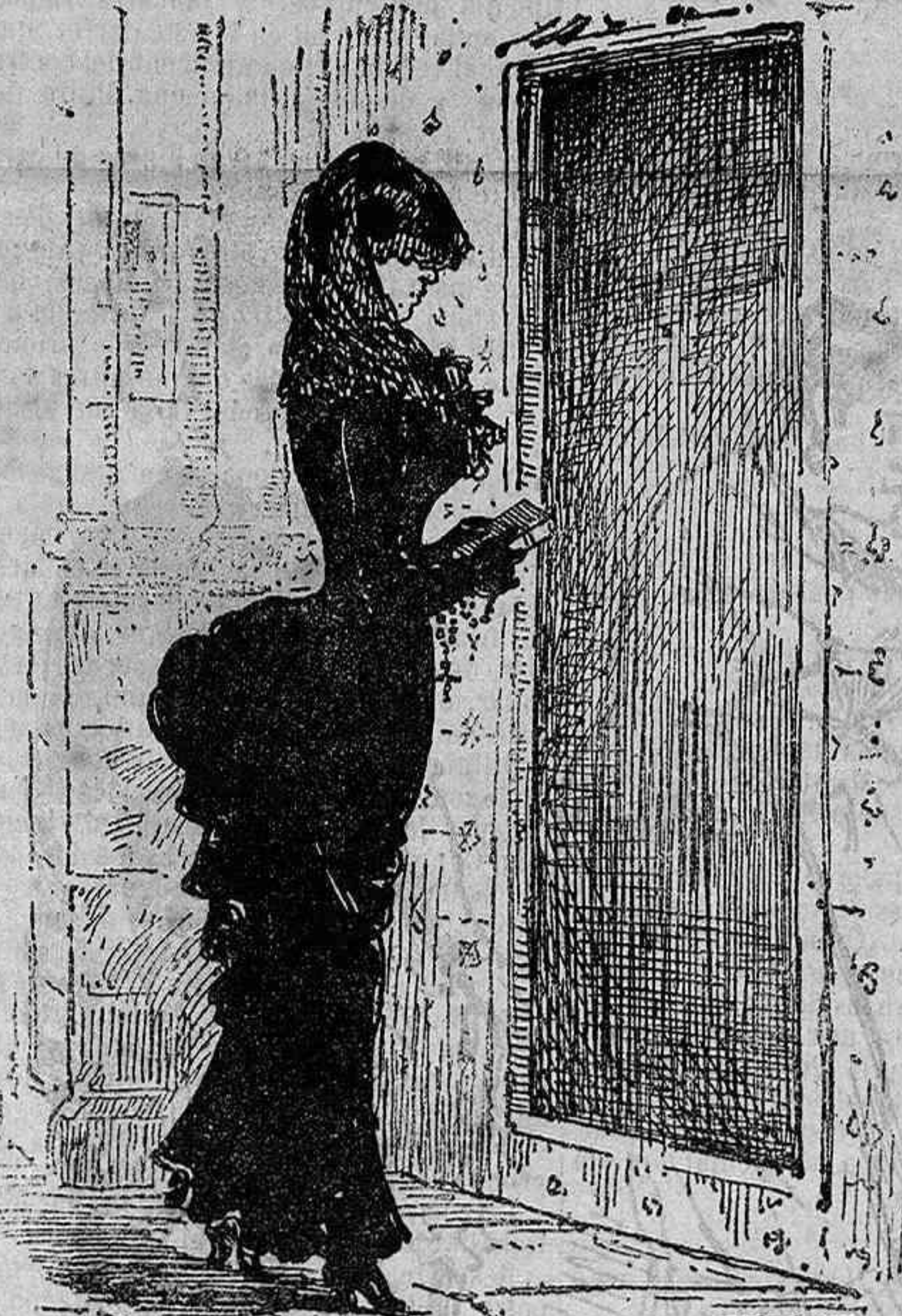
A la tarde al Sermó.