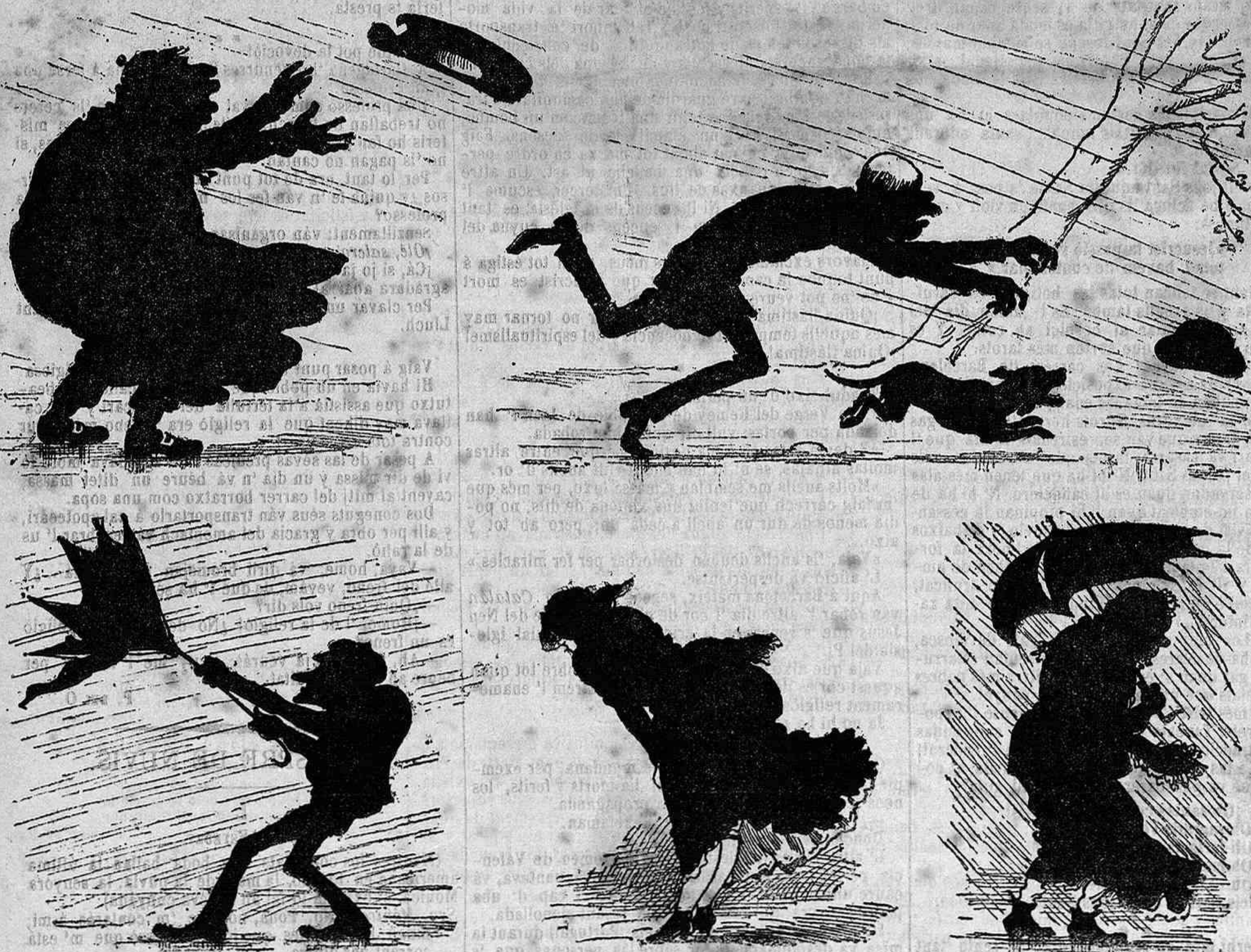
QUANT BUFA 'L LLEVANT. (CROQUIS DEL NATURAL.)