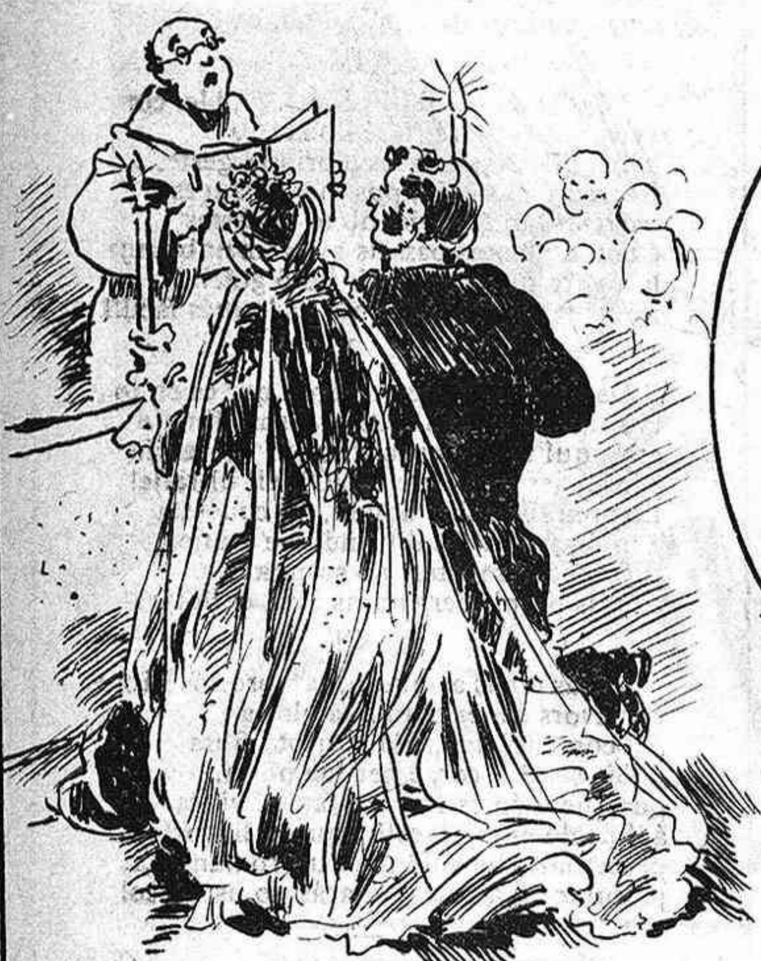
Tant amor, boig, li jurava que fins á durla á l' altar lo rich galan no parava.