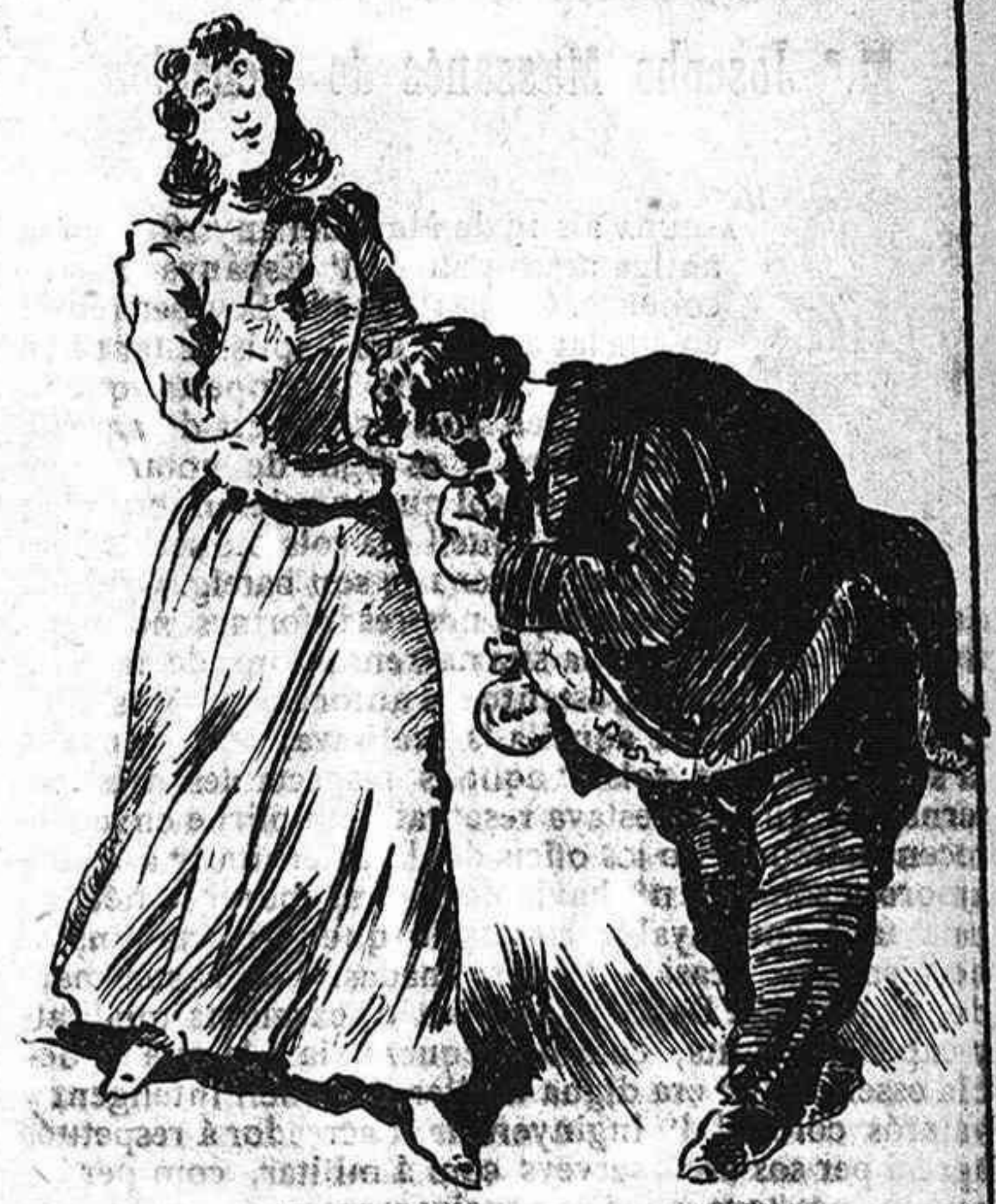
Y en prova de sa passió imprimia á sa ma blanca mes d' un cop un llarch petó.