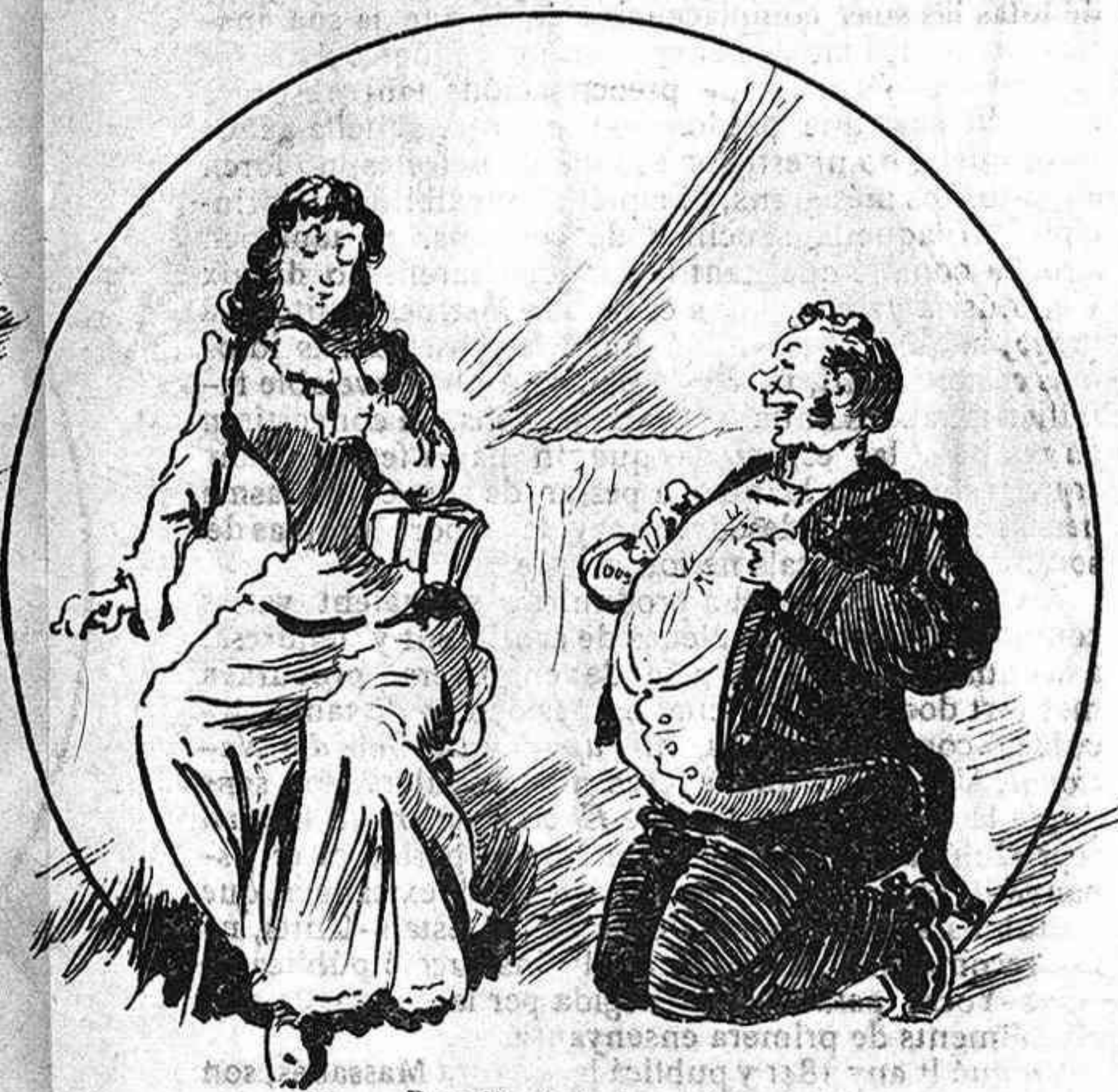
Rendit aixís á sos peus diners y amor li oferia obehint secretas veus.