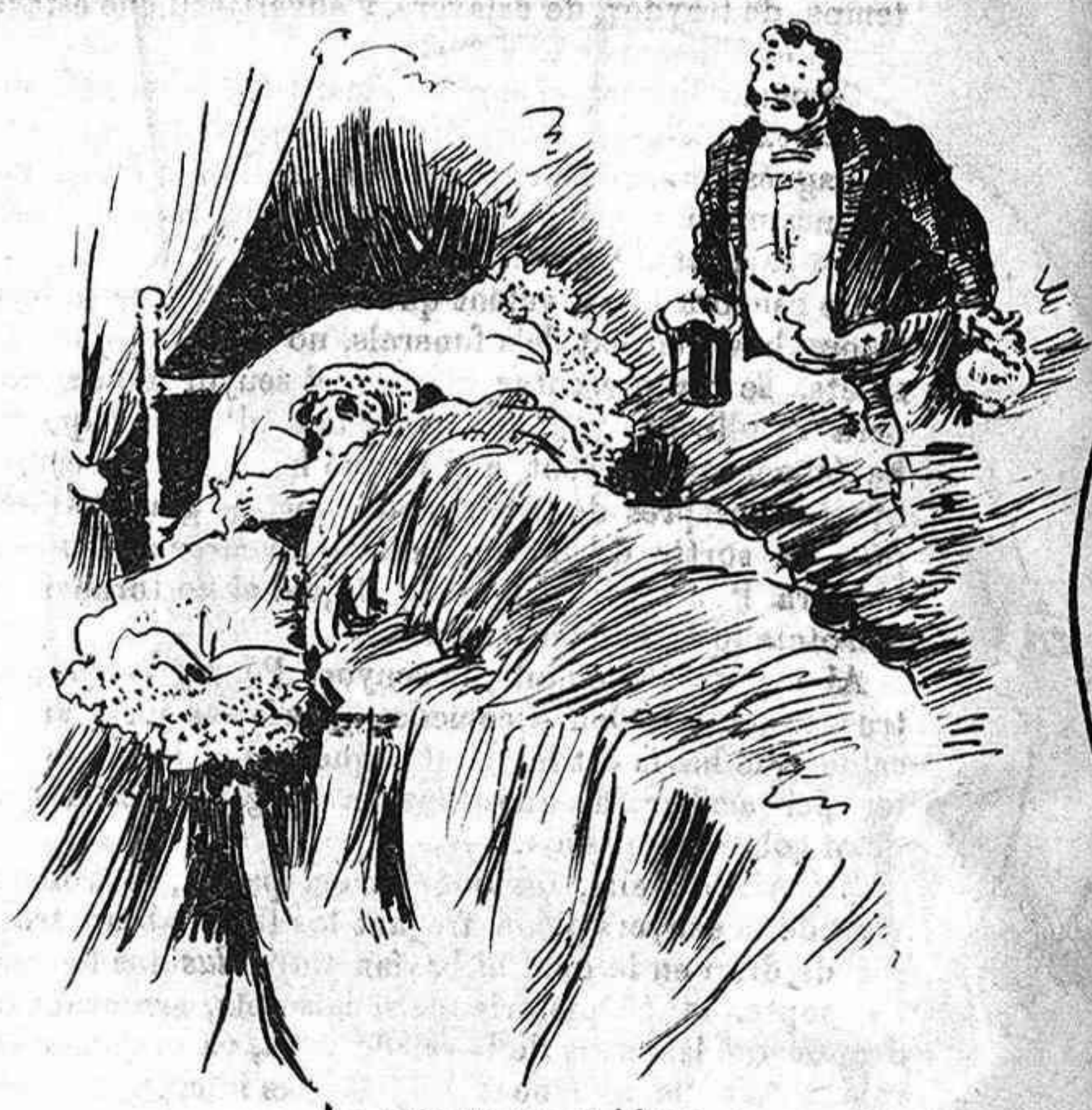
Lo casarse era sa ideya, y ab tal febre, un rich galan que la estimava ella veyá.