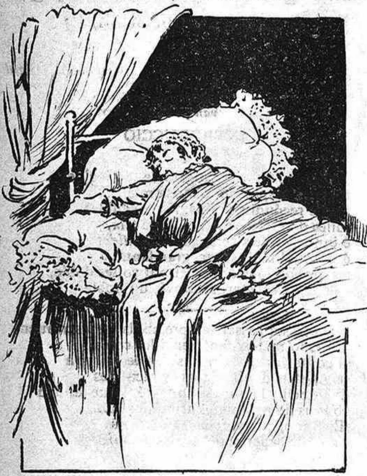
Acotxada dintre 'l lit somniava cosas molt dolças la Roseta cada nit.