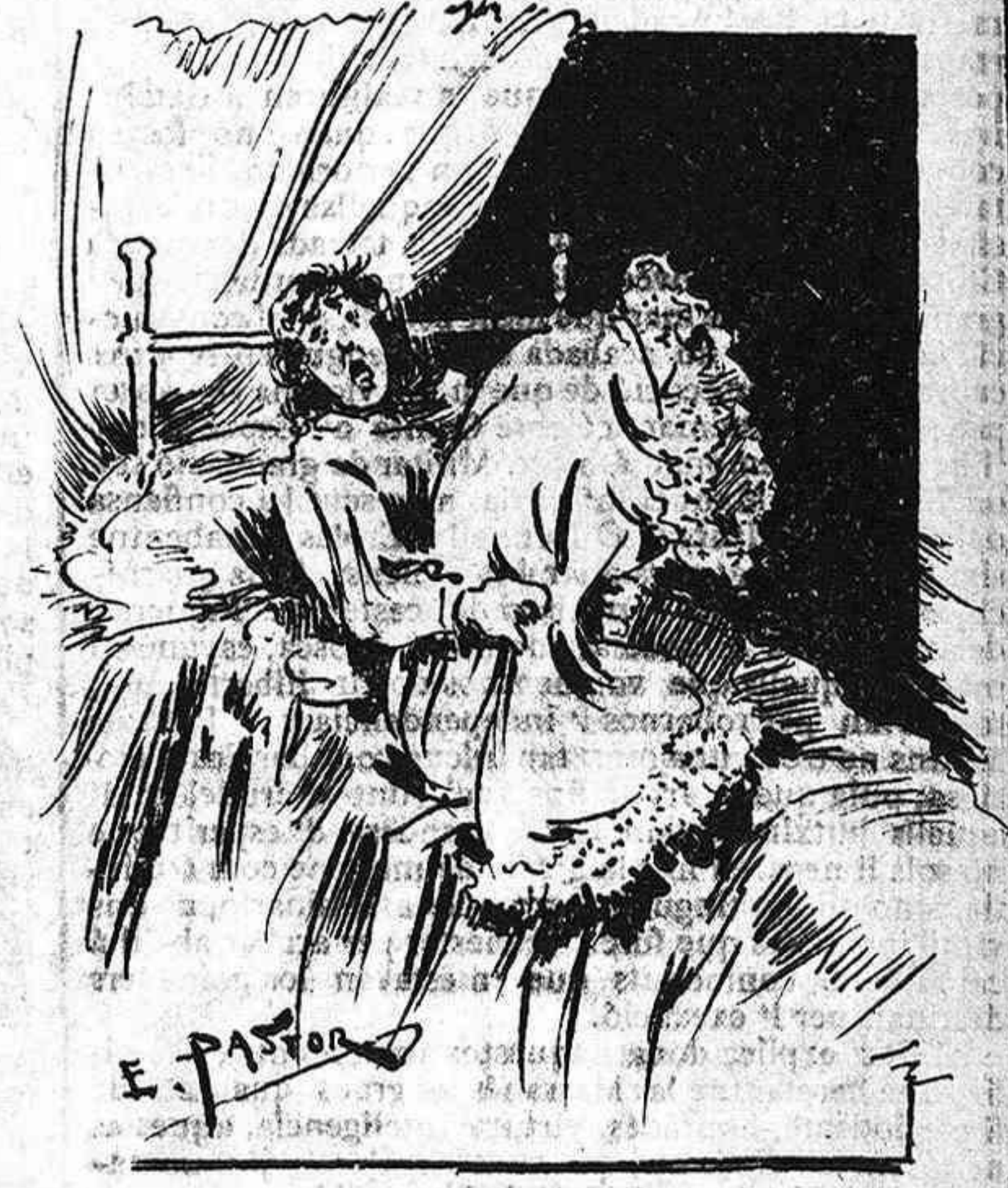
¡Mes ay! Del somni á la fi la Roseta 's despertava abressada... ¡ab lo coixí!