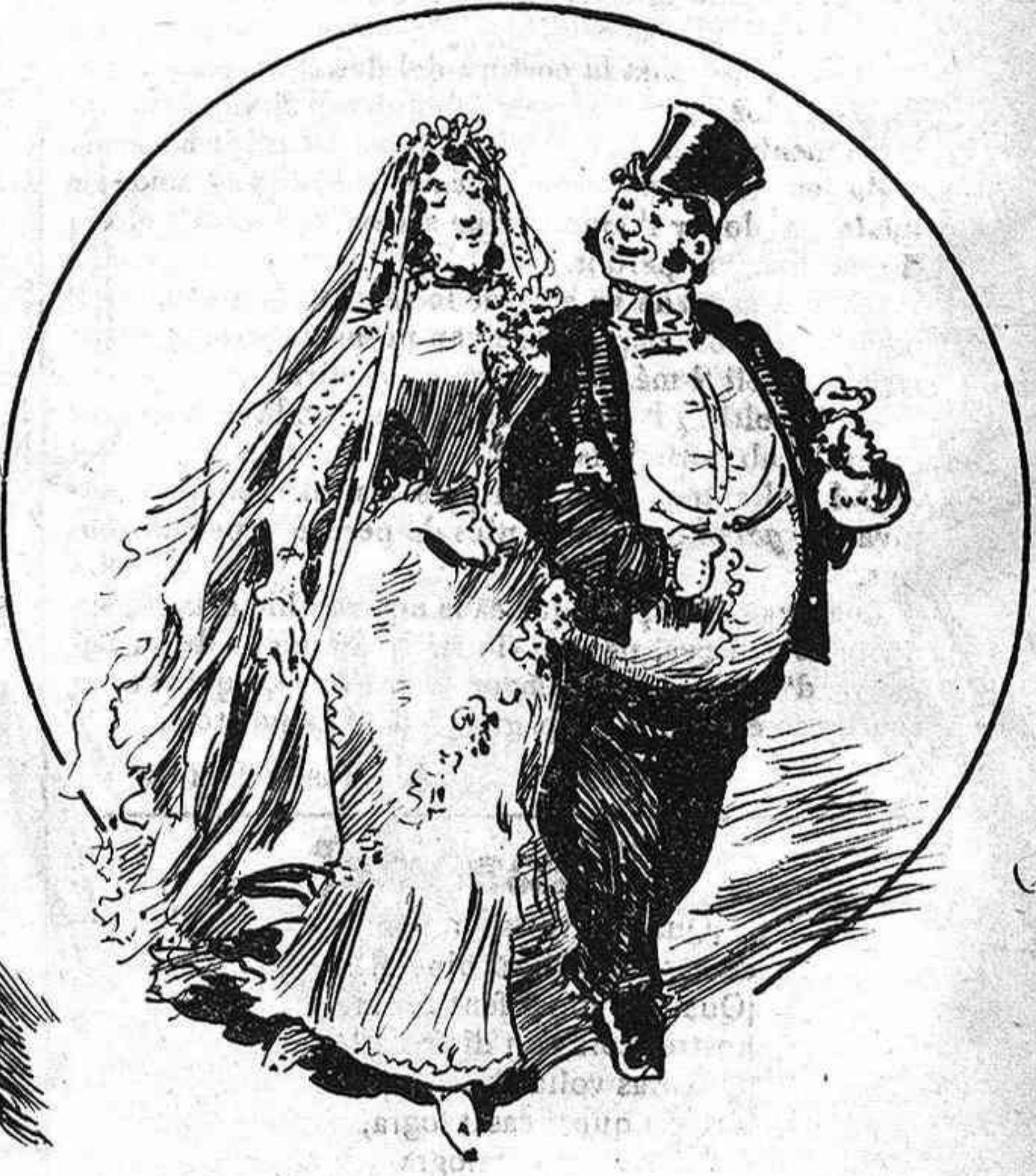
Y un cop nuvis, de brasset passejavan; ella alegre, y ell per ella satisfet.