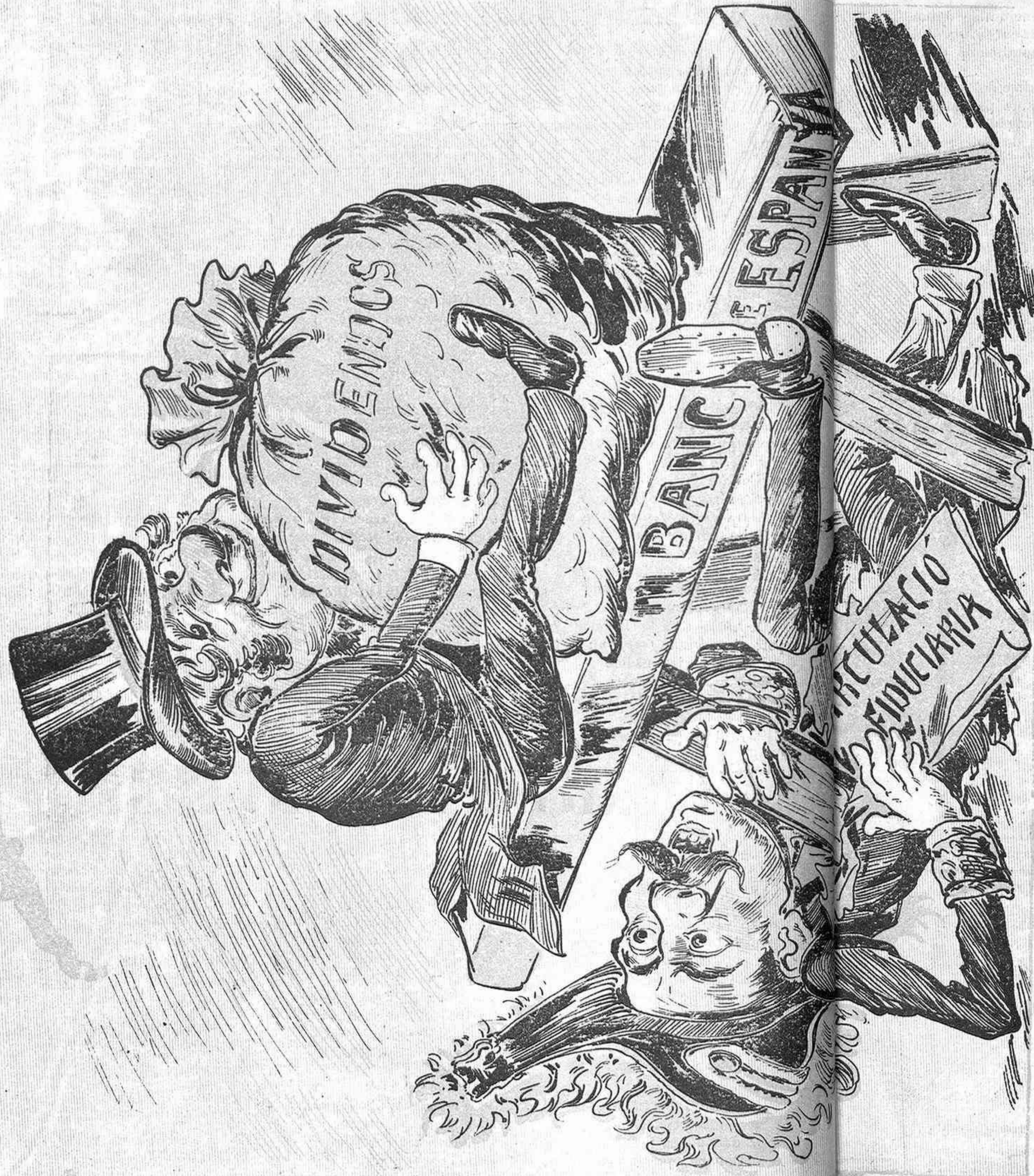
El ministre 's revenxina sota el banch, gros y feixuch; de la lluyta gegantina ¿quin dels dos será 'l vensut?