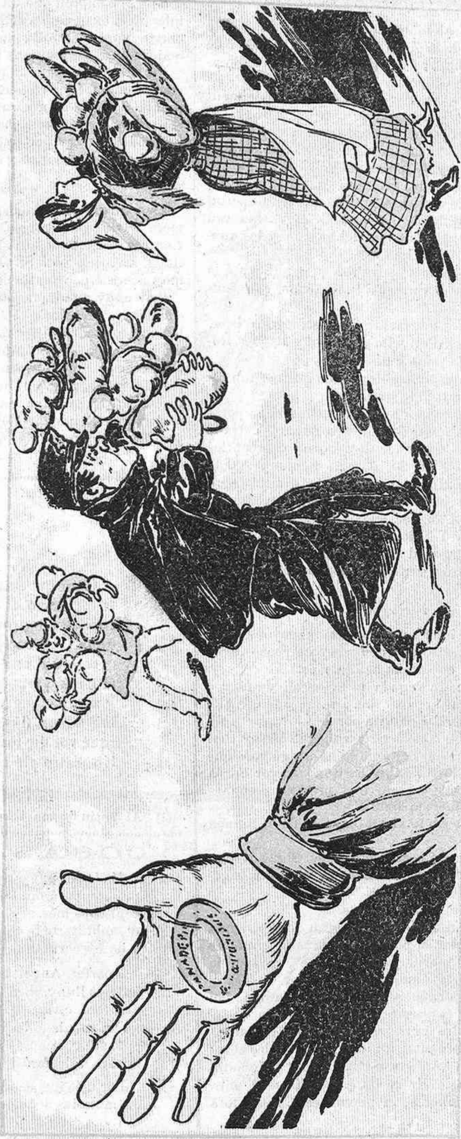
Un sagell marquí la má del qui pasti coca ò pá.