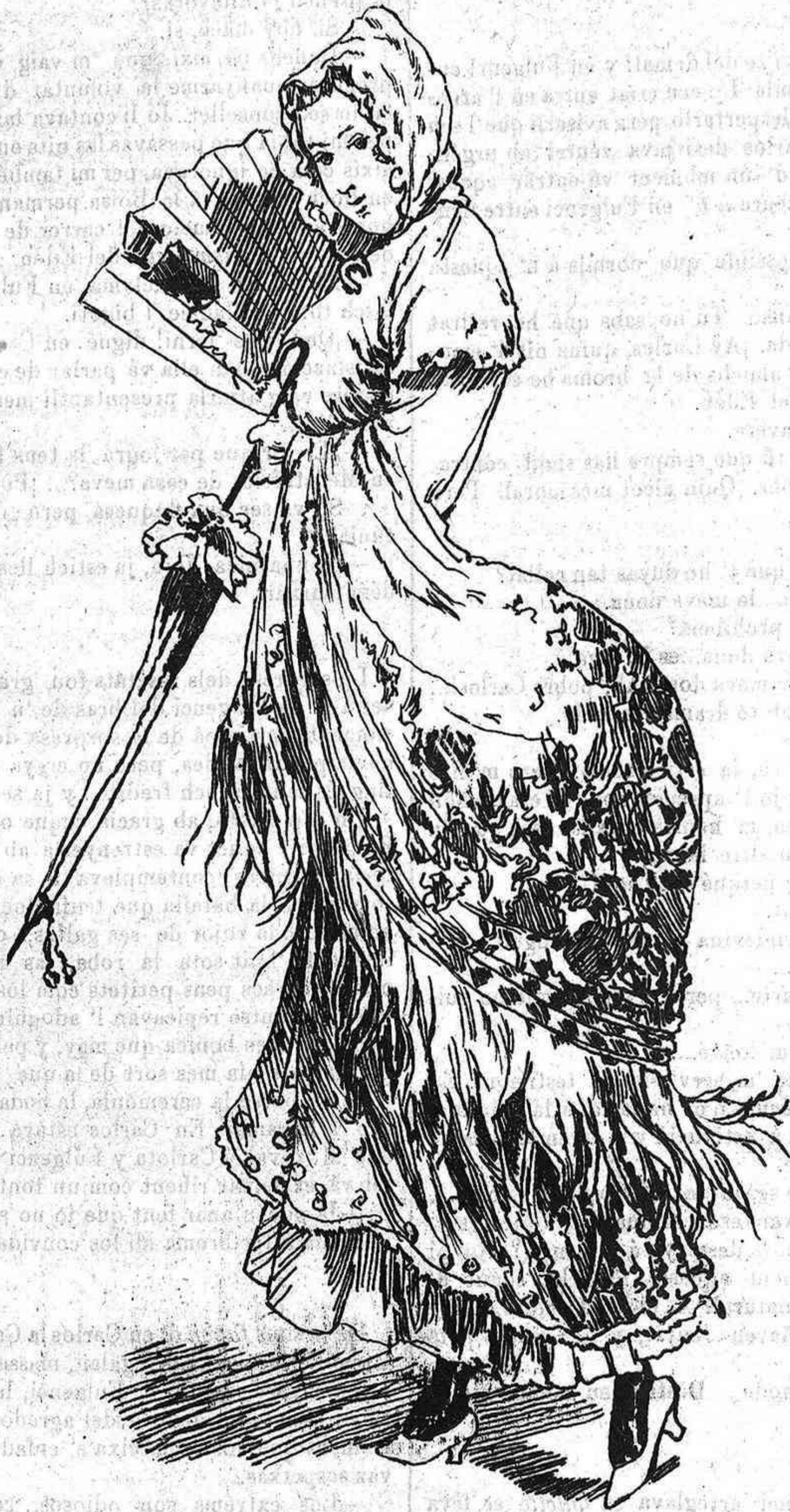
—Ab aquesta caló no 's fa un quarto.