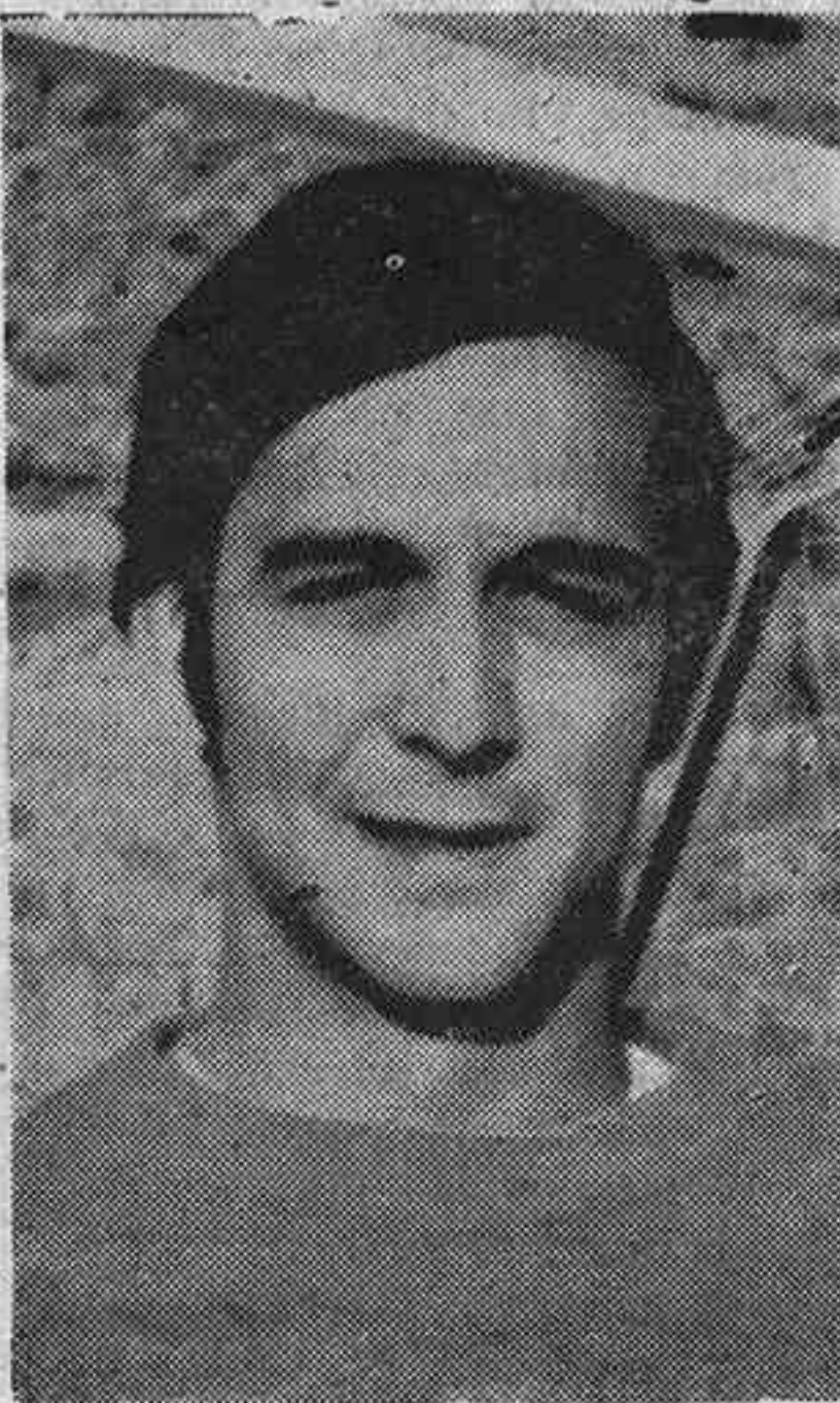
SESMA. Nuestro cancerbero se está consagrando como uno de los metas más brillantes de la Competición, siendo el domingo uno de los hombres más destacados en Talavera.

lavera difícil hueso de roer para nuestro equipo, más difícil a nuestro entender que el encuentro de Ciudad Real, ya que si bien el ambiente apasionado es similar, el Talavera