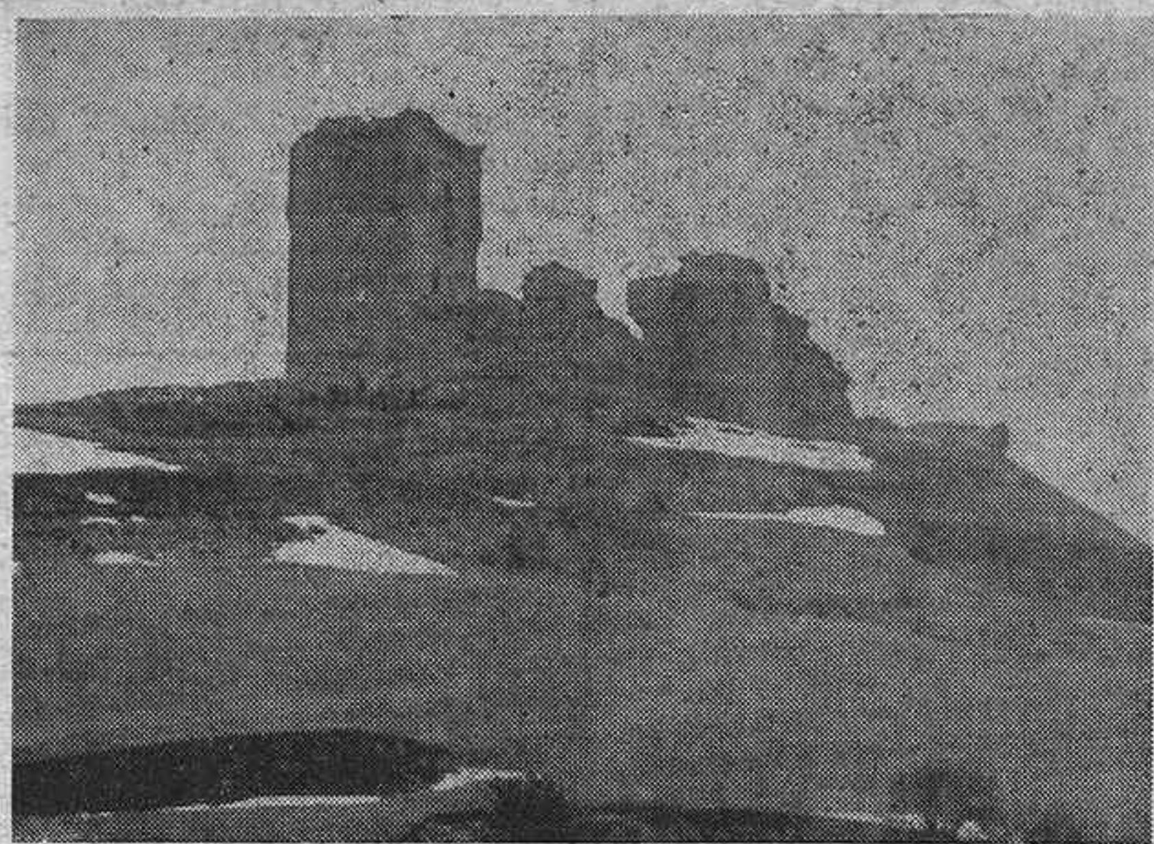
Castillo de Galve de Sorbe: 1.000.000 de pesetas.

En la mañana de hoy ha tenido lugar, en la Delegación de Hacienda de Guadalajara, el acto de pública subasta de las ruinas de los castillos de Galve de Sorbe y Riba de Santiuste, anunciados oportunamente en el Boletín Oficial de la provincia, según dimos cuenta en su momento.