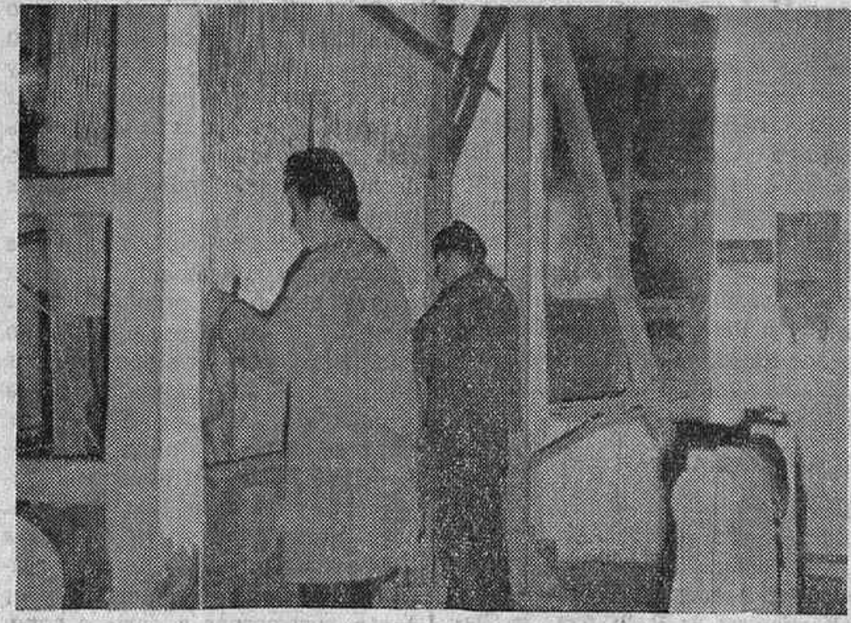
La confección de alfombras, una de las actividades más próximas. En la foto, un detalle del trabajo en telar.

Se agrupan en ella cuantos participan en los trabajos de los talleres de Laborterapia, en los que se fabrican obras de forja, elementos de decoración en chapa, muebles (pasa a la última página)