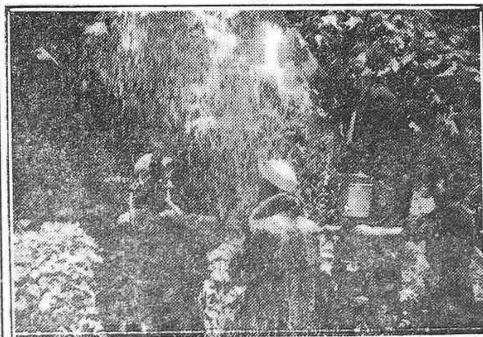
TODAVIA reina gran calor en Los Angeles, pero los modistos han lanzado ya los modelos de invierno y he aquí el procedimiento que utilizan para demostrar a sus clientes las excelencias de sus pieles, sometiéndoles a una intensa "nevada" desde lo alto de una escalera.

Esto es necesario también por una razón decisiva y apremiante. En todas partes de Asia está creciendo el convencimiento de que los Estados Unidos le han echado tierra, no sólo a China, sino a toda el Asia. Este convencimiento es la ventaja mayor con que cuenta Molotov. Hay que convencer a Asia, primero, de que los Estados Unidos no tienen ambiciones imperialistas, y, en segundo lugar, de que no se permitirá que Asia sucumba a un nuevo imperialismo soviético. El mejor modo de hacer esto es nombrar un jefe supremo para dirigir el gran esfuerzo norteamericano en Asia, y concederle el dinero y la autoridad que debe tener si se ha de detener el empuje soviético en aquel continente.