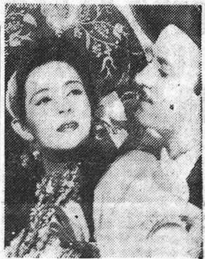
Sofía Alvarez y Pedro Infante en la extraordinaria película que distribuye Cifesa "Si me han de matar mañana", con la que Rialto inaugurará el próximo jueves su gran temporada cinematográfica

La interpretación de "El reloj asesino" es impresionante, a tono con la magnitud del argumento. Ray Milland triunfa de nuevo como actor dramático, y Charles Laughton levanta comentarios elogiosos por la admirable naturalidad de su arte. Dos bellas y magníficas actrices, Maureen O'Sullivan y Rita Johnson completan el estrellato de esta magnífica película Paramount dirigida por el famoso realizador John Farrow, y que presentada por Mercurio Films, Sociedad anónima, llena diariamente el luminoso local del cine Avenida, porque "El reloj asesino" no defrauda las esperanzas de los aficionados a este género de películas, sino que muy al contrario, aporta novedades sensacionales que hasta la fecha eran desconocidas.