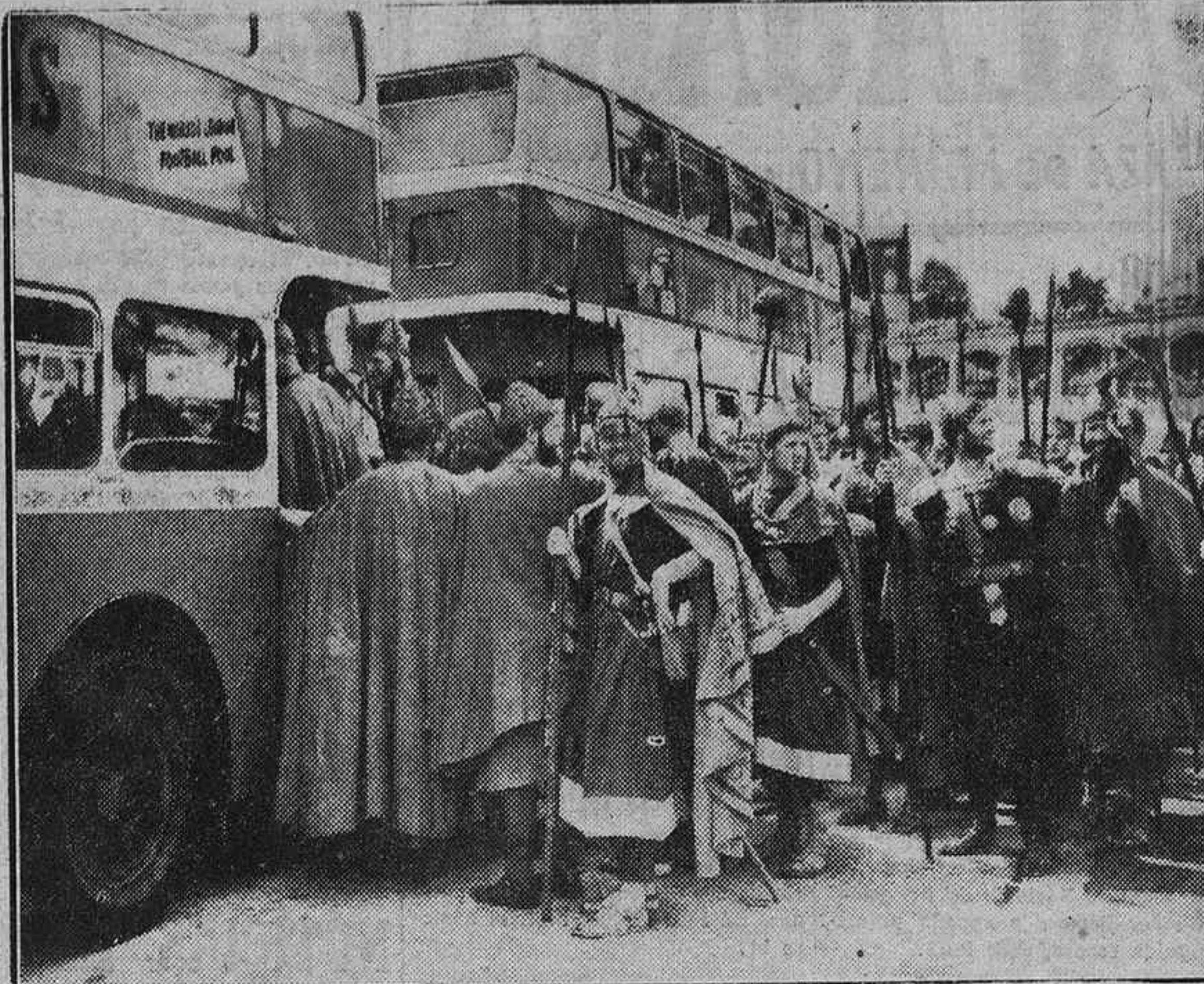
Han continuado en Inglaterra los actos conmemorativos del MD aniversario de la llegada a la isla de los primeros vikingos. Los desembarcados hace unos días efectuaron una representación histórica ante distinguidas personalidades, dando lugar a pintorescos contrastes, como éste que recoge nuestra foto. Los descendientes de Hengest y Horsa, vestidos con trajes del siglo V, hacen cola ante los autobuses en Ranagate.