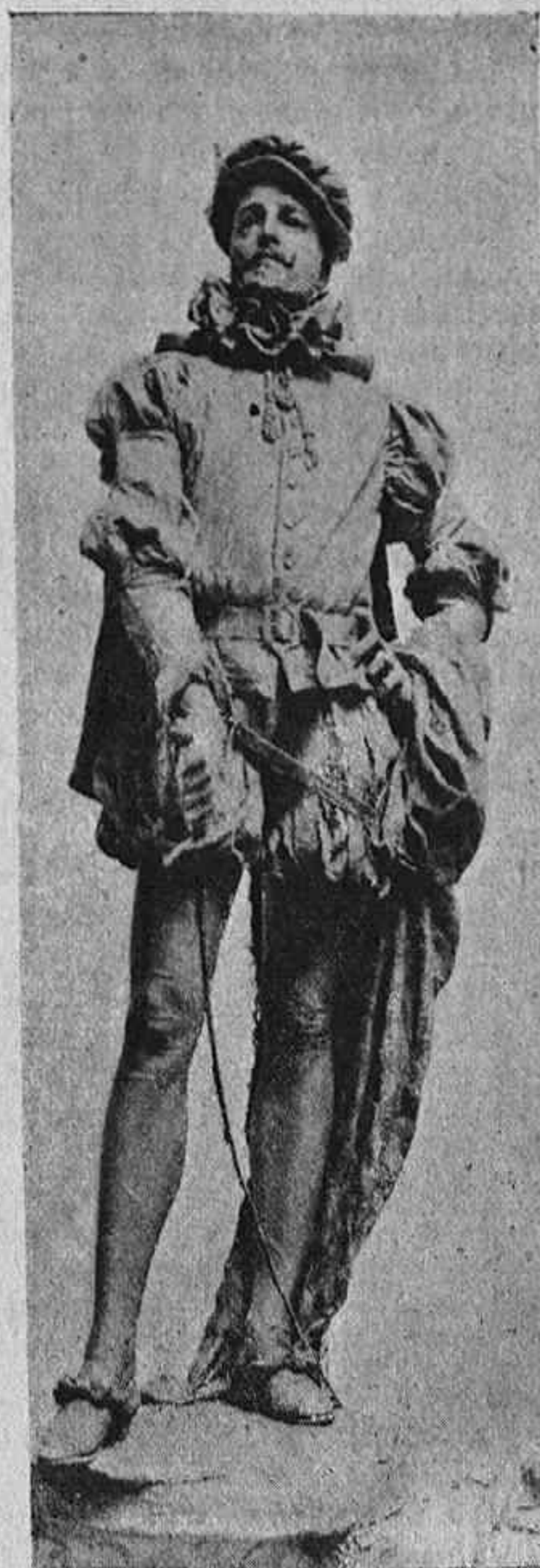
D. JUAN TENORIO.—Escultura de Querol.