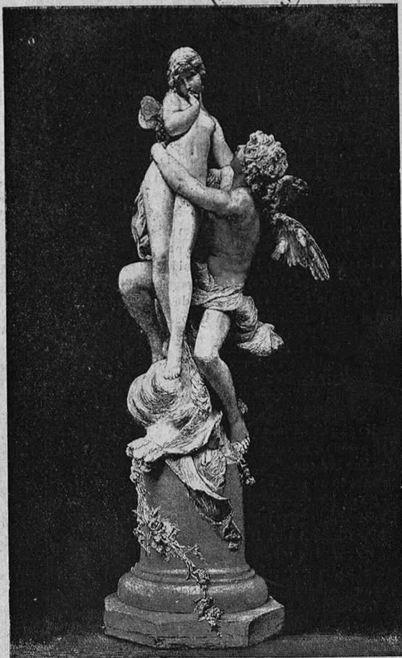
UN ÁNGEL ROBANDO EL AMOR