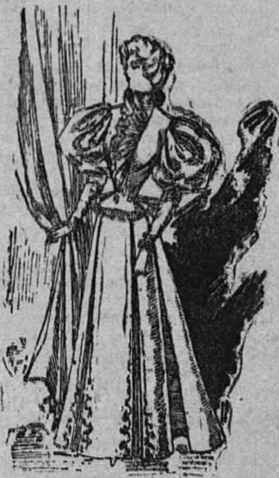
Traje para visita.

Modelos exclusivos para nuestras lectoras, de los Grandes Almacenes de EL SIGLO, Barcelona (1).