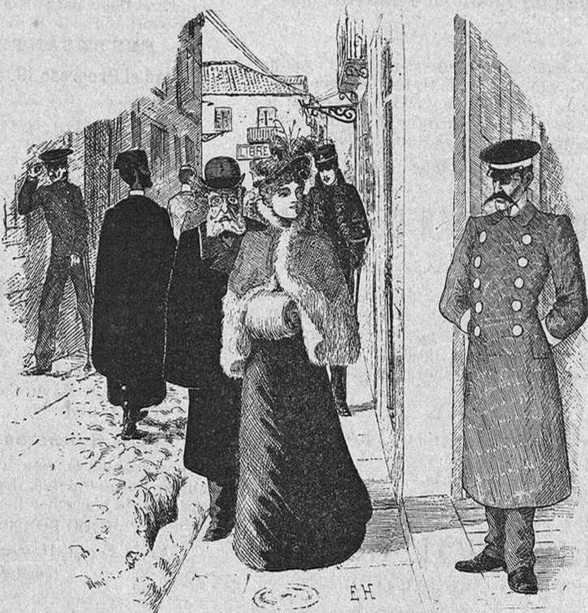
A LA PUERTA DEL CASINO,

Sepulcro de Beltrán de Azagra , por B. Villaverde.