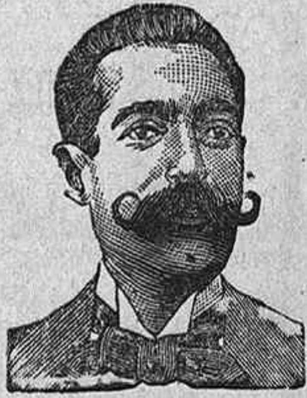
A. SALVATI COSTANZI CALLE DIPUTACION 435 BARCELONA