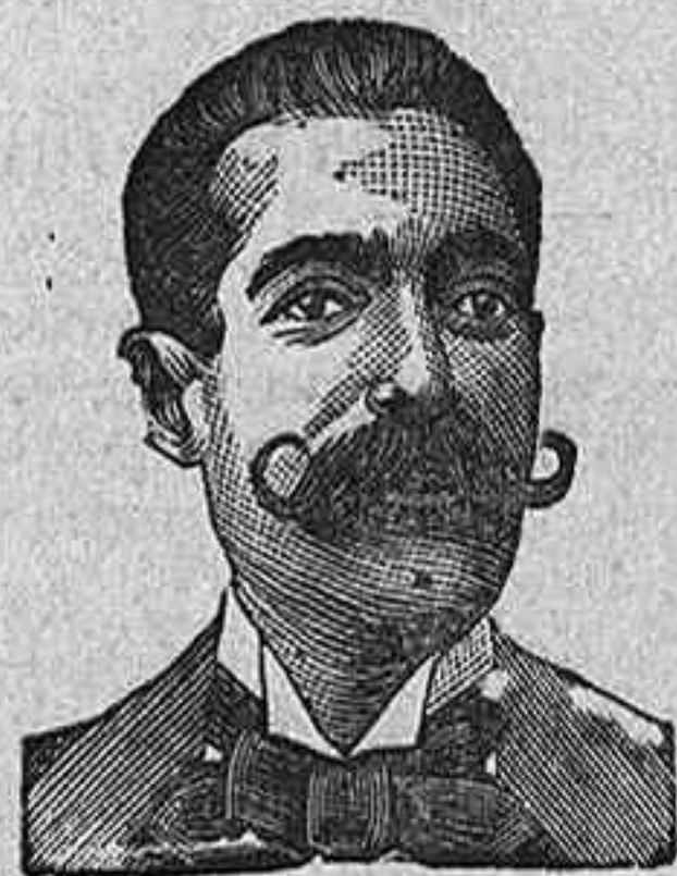
A. SALVATI COSTANZI CALLE DIPUTACION 435 BARCELONA