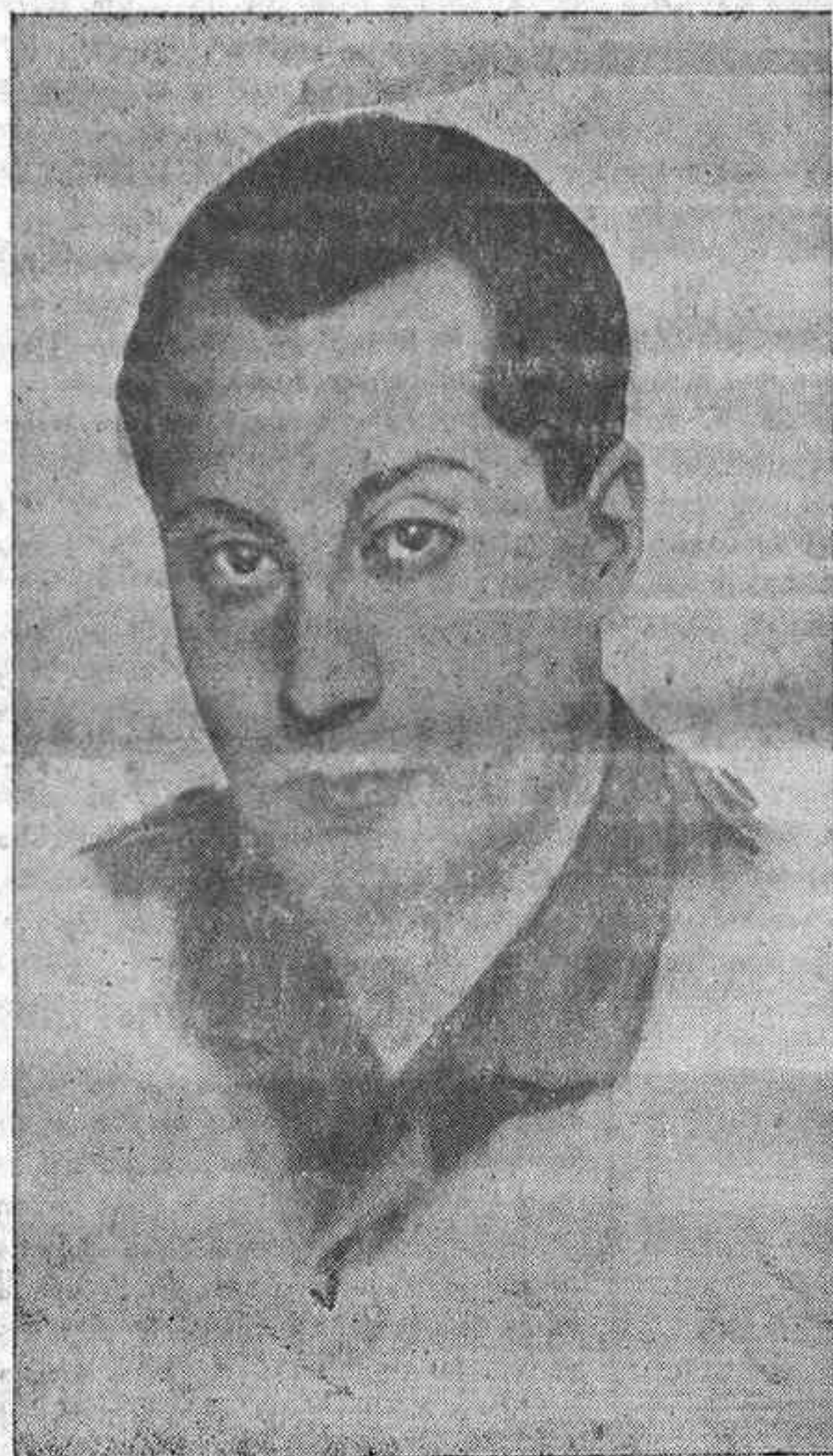
En toda la provincia, las Jefaturas Locales organizarán actos conmemorativos en dicha fecha, con la celebración