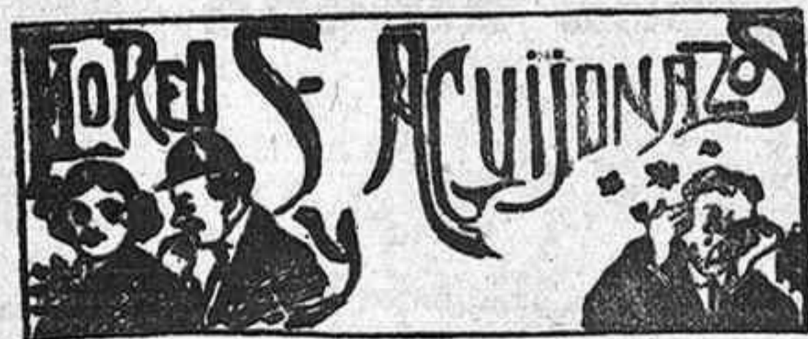
Mi Musa llora

Se ha perdido, en los alrededores de la Academia, la noche del incendio, una maleta que contenía prendas de uniforme y libros. Tenía las iniciales J. P. y era de lona de color kaki. Se indemnizará a quien la entregue en Mayor, 45, pral. izquierda.