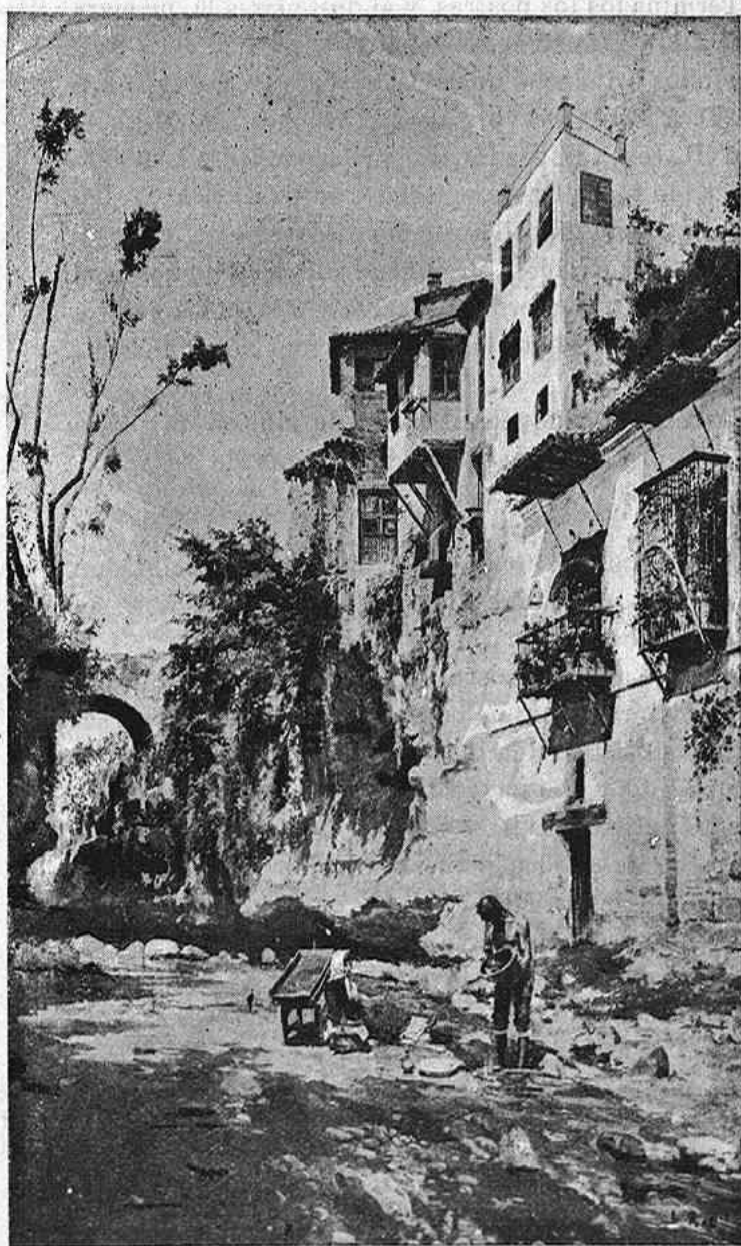
Dibujo de D. José de Larrache.