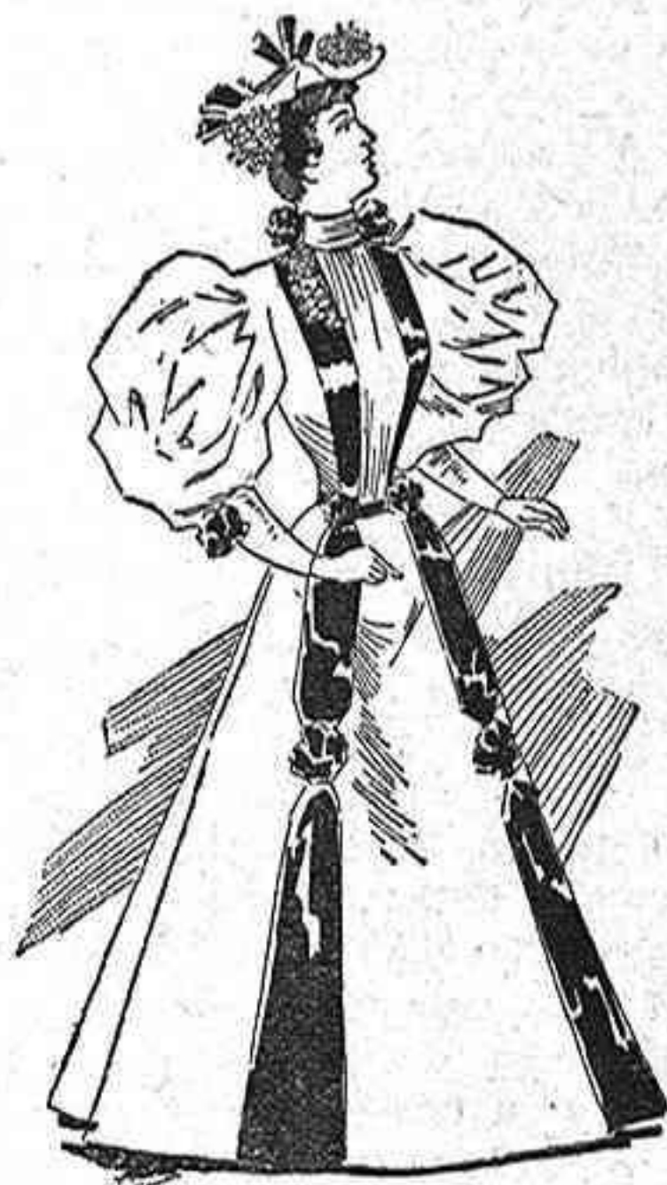
Traje para visita.

(Modelos exclusivos para nuestras lectoras, de los grandes almacenes de EL SIGLO, Barcelona.) (1)