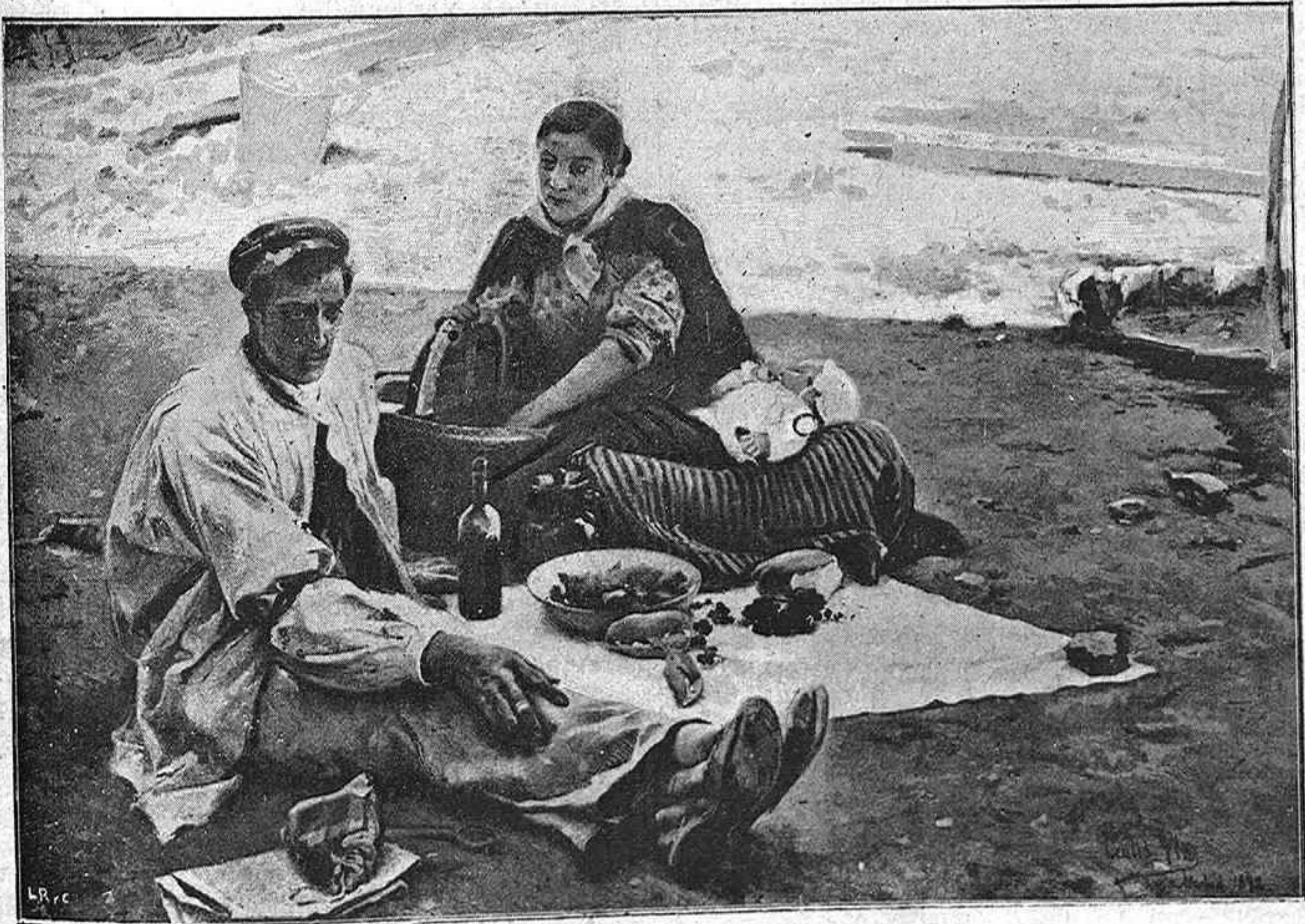
(CUADRO DE CECILIO PLÁ)