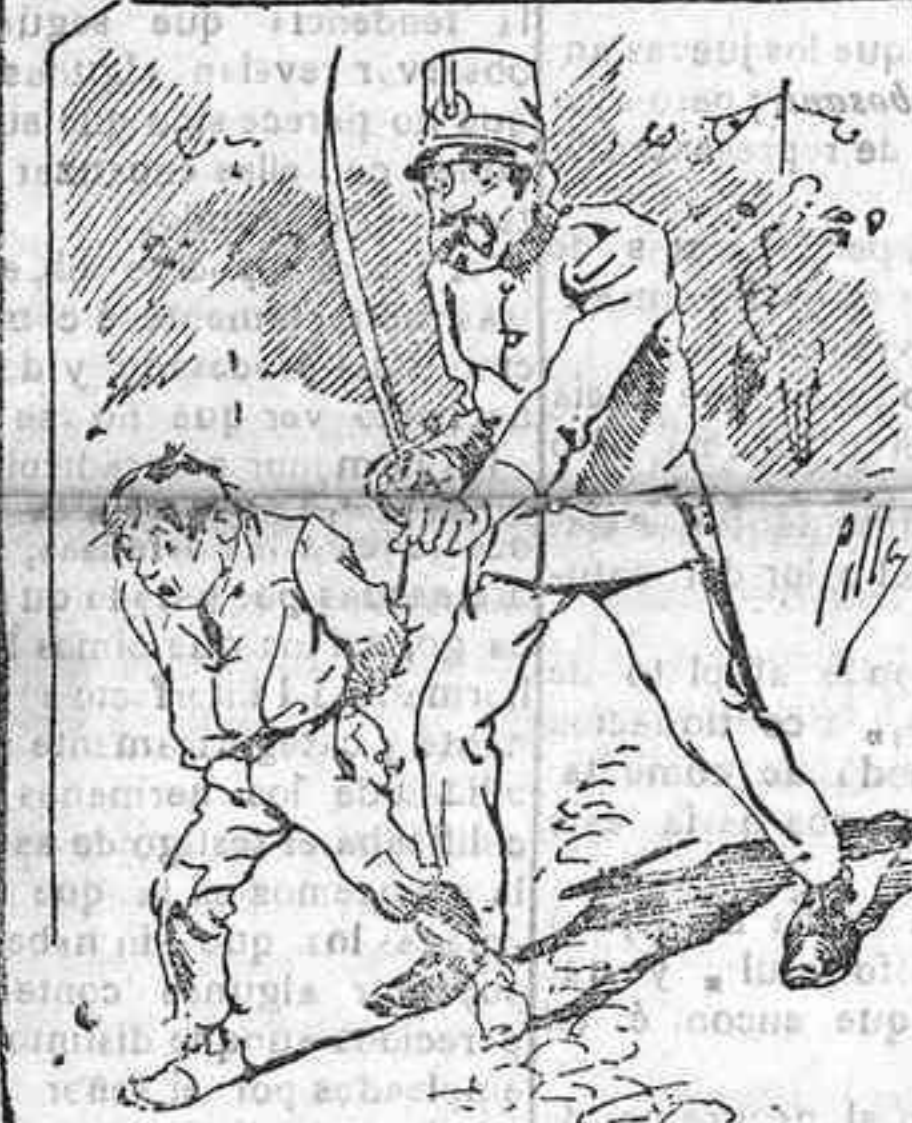
Tratamientos de la policía á nuestros vendedores cuando el número pica.....