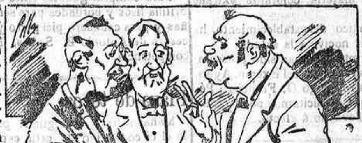
Abominan á nuestros libros... pero los compran.