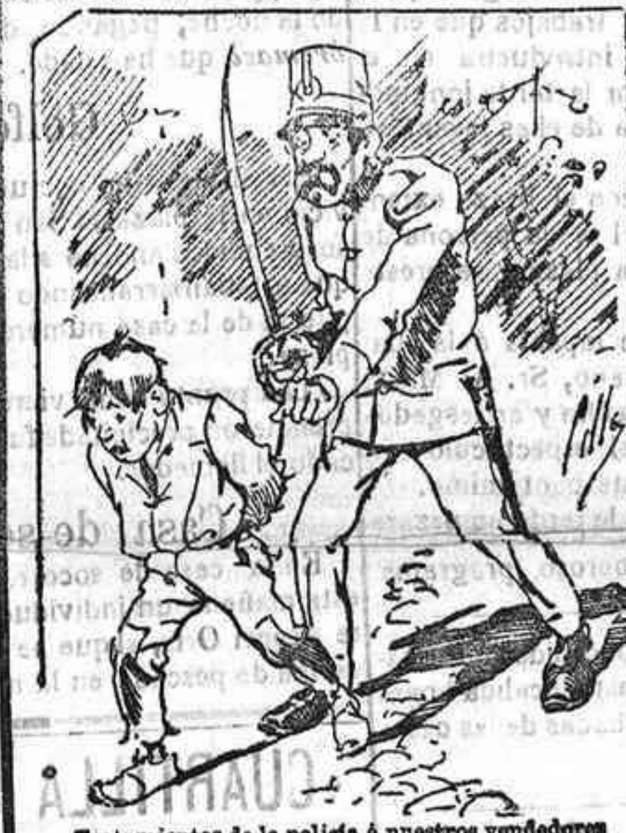
Tratamientos de la polidía á nuestros vendedores cuando el número pide...