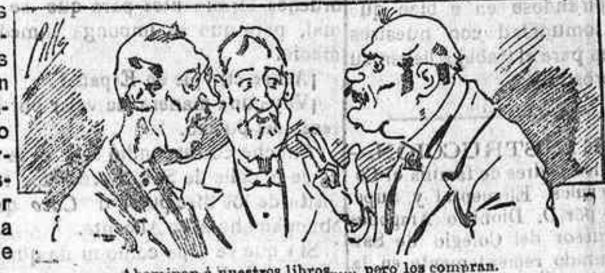
Abominan á nuestros libros... pero los compran.

Todas las personas de gusto, curiosas é ilustradas deben pedir al Director de LA AVISPA, apartado núm. 8, MADRID, un ejemplar que se remite gratis y franqueado. Esta Revista Enciclopédica Popular, publica recreaciones científicas, recetas de cocina, repostería, confitería, vinos, licores, pinturas, barnices, betunes y formulas para toda clase de industria, y cuantas noticias y conocimientos puedan ser beneficiosos. Cuenta además con buenos grabados, parte literaria excelente; da regalos mensuales á sus lectores con la Lotería Nacional y participaciones en la misma, á cuyo efecto compra todos los sorteos, y en una de las Administraciones más afortunadas por la suerte, billetes enteros. La suscripción y los números que se nos pidan se sirven gratuitamente á correo vuelto y franqueados, con sólo indicar el nombre y dirección de que lo desea en sobre dirigido al Sr. Administrador de