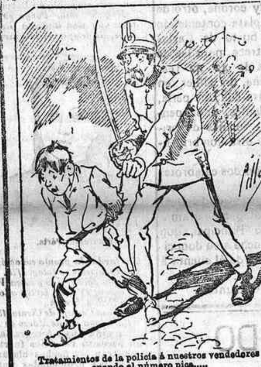
Tratamientos de la policía á nuestros vendedores cuando el número pica....