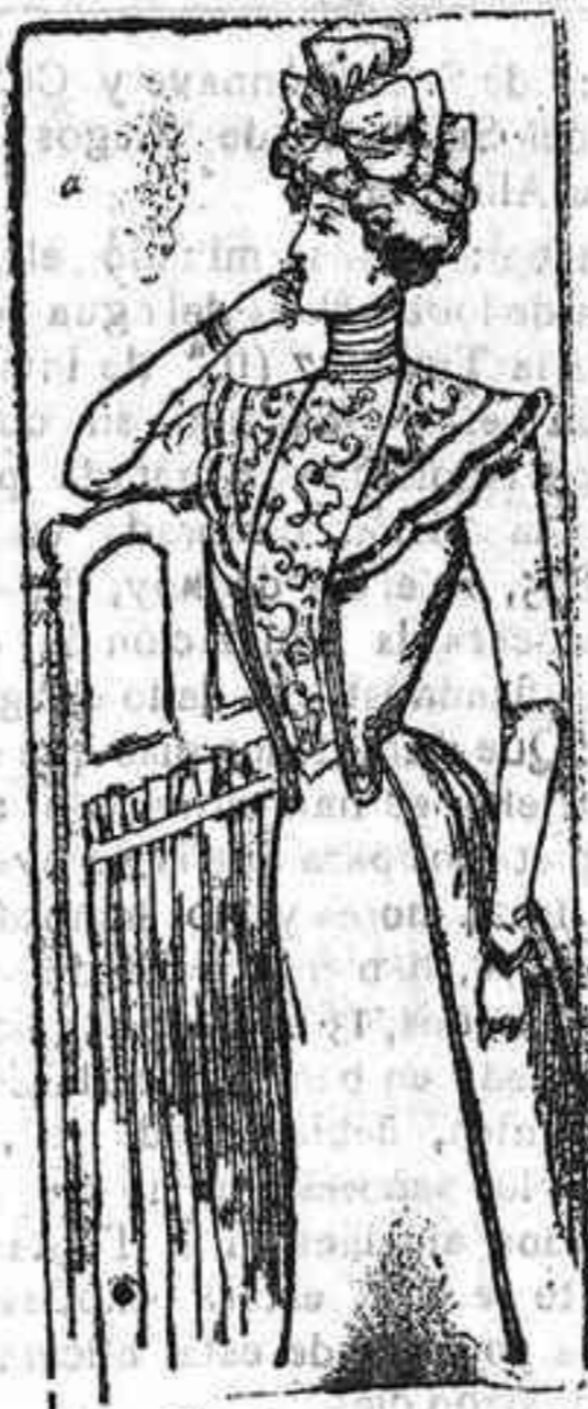
Traje para señorita

Modelos exclusivos para nuestras lectoras de los grandes almacenes de EL SIGLO, Barcelona.