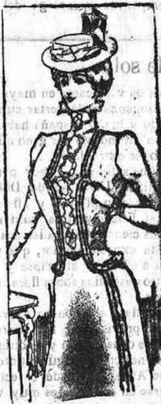
Traje para señorita

tinto color al del traje. El bordé de este cuello es el de piel blanca. Peto completamente bordado; manga estrecha adornada en el puño y falda acampanada con un biés á lo largo, en la forma indicada en este dibujo