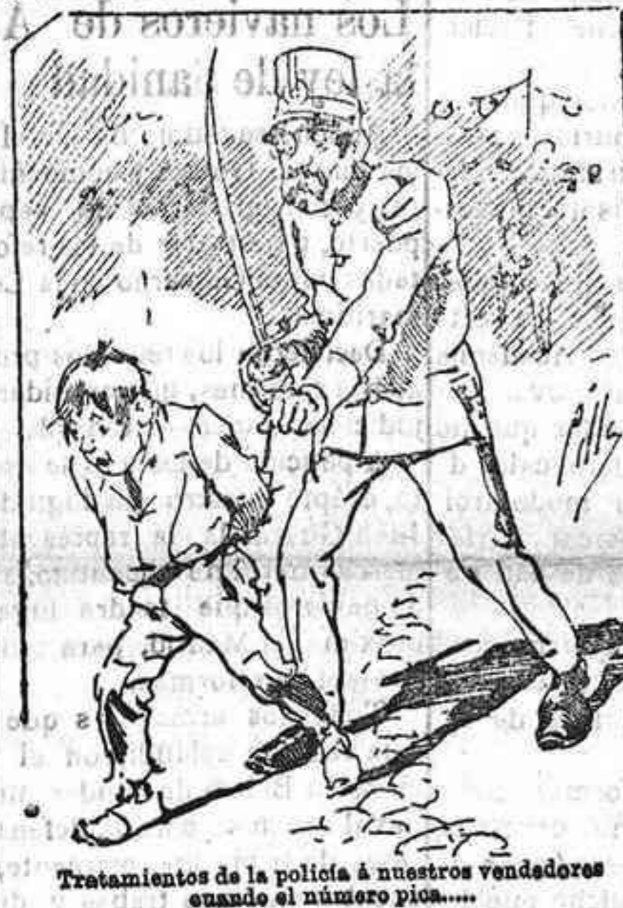
Tratamientos de la pelicia á nuestros vendedores cuando el número pide.....

También puede pedirse LA AVISPA y el CATALOGO RESERVADO en casa de nuestros corresponsales autorizados, si no se quiere escribir á la Administración.