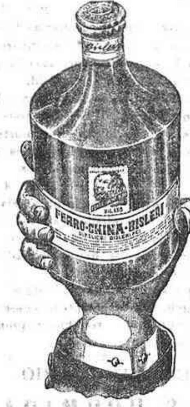
Ferro-Quina-Bisleri. APERITIVO HIGIÉNICO. Reconstruyente de primer orden. Recomendado por toda la clase Médica.