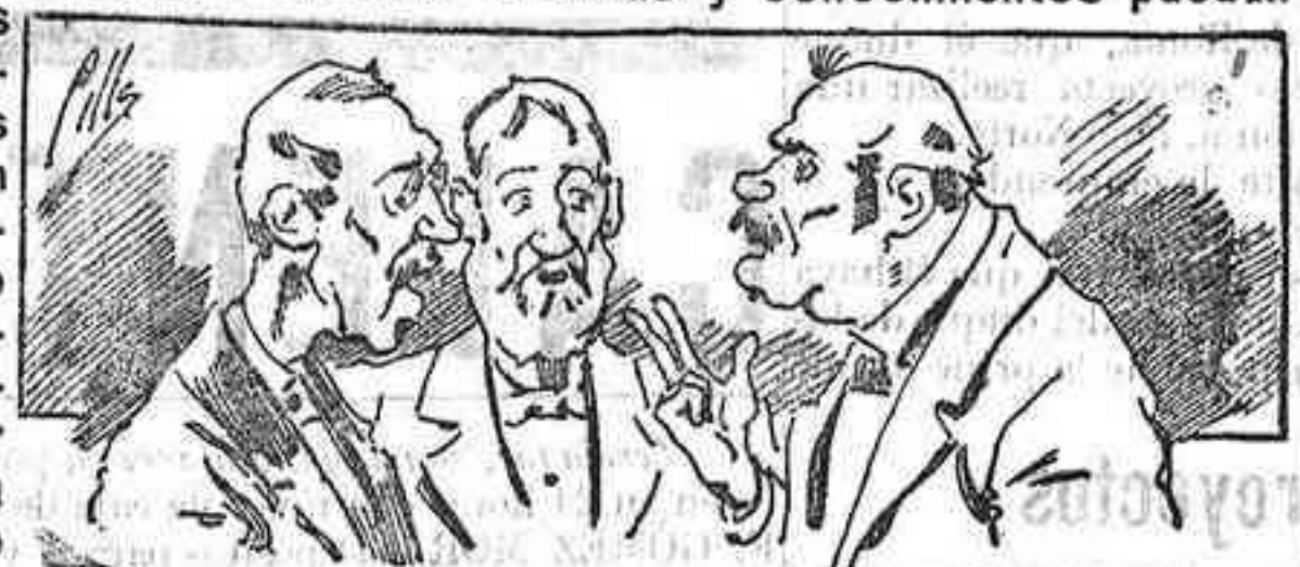
Abominan a nuestros libros..., pero los compran.

Todas las personas de gusto, curiosas e ilustradas deben pedir al Director de LA AVISPA, apartado núm. 8, MADRID, un ejemplar que se remite gratis y franqueado. Esta Revista Enciclopédica Popular publica recreaciones científicas, recetas de cocina, repostería, confitería, vinos, licores, pinturas, barnices, betunes y fórmulas para toda clase de industria, y cuantas noticias y conocimientos puedan ser beneficiosos. Cuenta además con buenos grabados, parte literaria excelente; da regalos mensuales a sus lectores con la Lotería Nacional y participaciones en la misma, a cuyo efecto compra todos los sorteos, y en una de las Administraciones más afortunadas por la suerte, billetes enteros. La suscripción y los números que se nos pidan se sirven gratuitamente a correo vuelto y franqueados, con sólo indicar el nombre y dirección del que lo desea en sobre dirigido al Sr. Administrador de