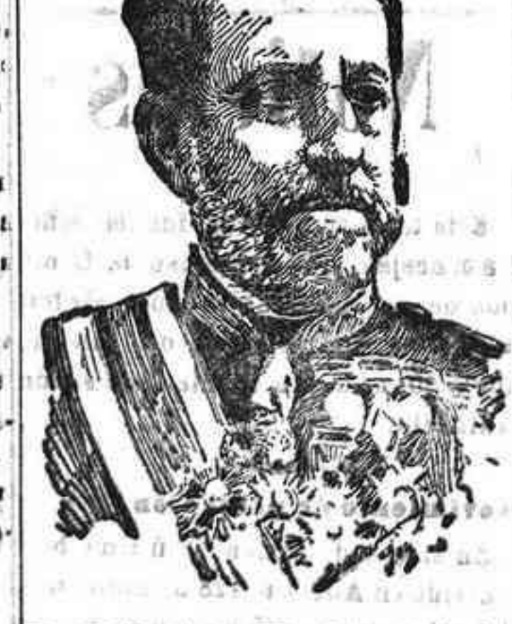
D. Valeriano Weyler y Nicolau