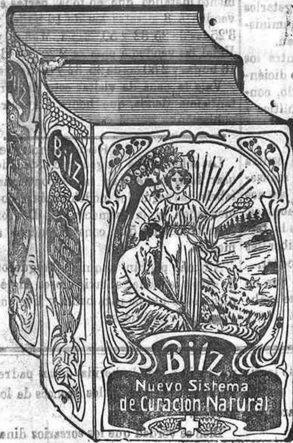
Ejemplar de la encuadernación