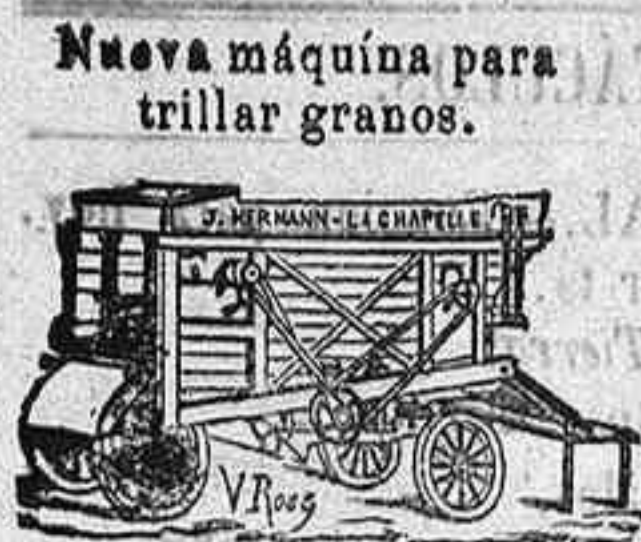
Nueva máquina para trillar granos.

Nuevos molinos de harina sobre zócalo Boffeoi de hierro.